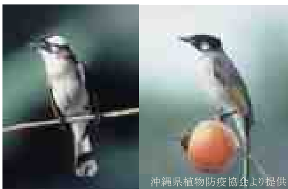
図1 成鳥:後頭部の白い個体(左) と黒い個体(右)