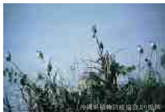
図2 群れを形成したシロガシラ