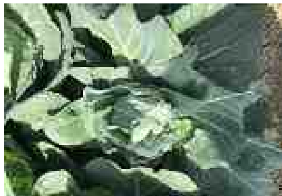
図4 キャベツの被害