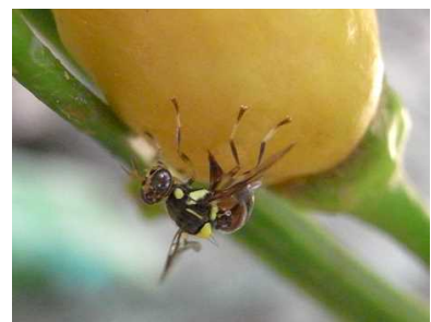
図3 シマトウガラシに産卵するナスミバエ雌成虫