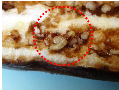
図2 ナスミバエ幼虫