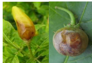
図6 シマトウガラシ(左)とテリミノイヌホオズキ(右)の被害