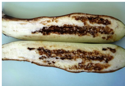
図5 ナス果実の内部腐敗