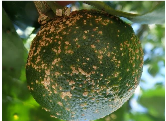
図4 そうか病の果実被害（そうか型）