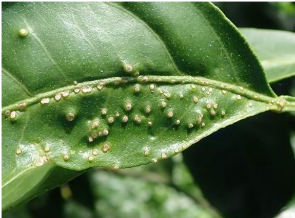
図3 そうか病の葉被害（イボ型）