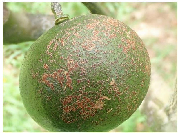
図6 黒点病の果実被害（泥塊状病斑）