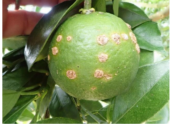
図2 かいよう病の果実被害