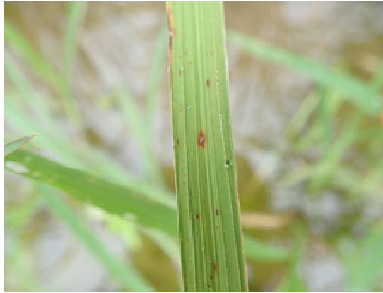
図3 いもち病病斑（褐点型）