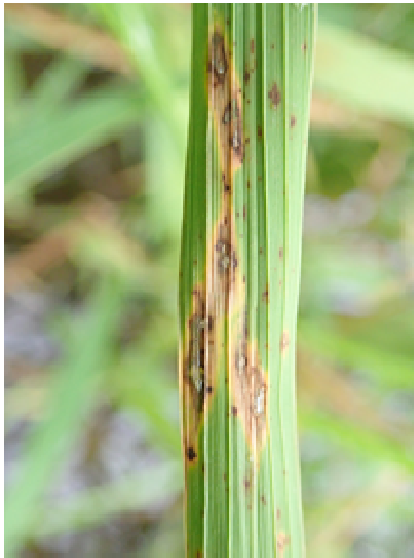
図4 いもち病病斑（湿潤～止まり型）