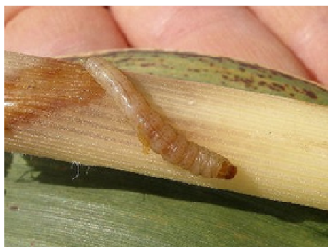
図4 カンシャシクイハマキ幼虫