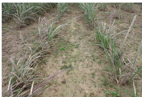
図3 伊是名村被害ほ場