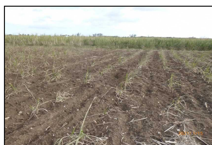
図2 久米島町被害ほ場