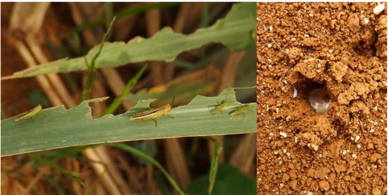
図3 サトウキビ葉の被害