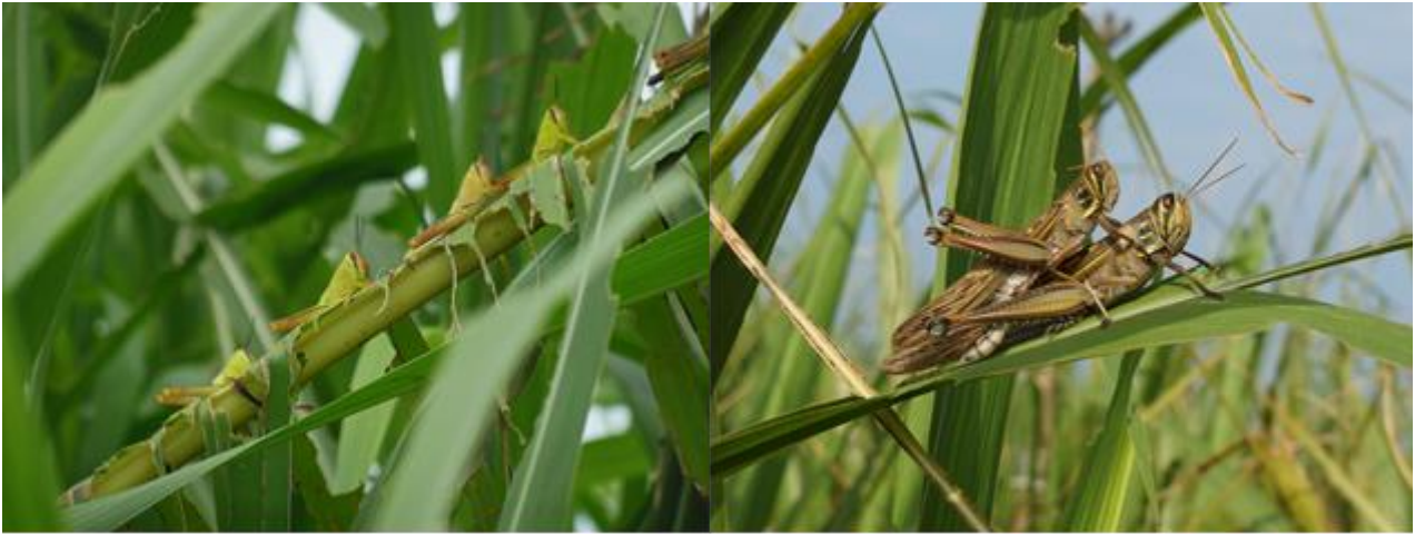
図2 幼虫(左)と成虫(右)