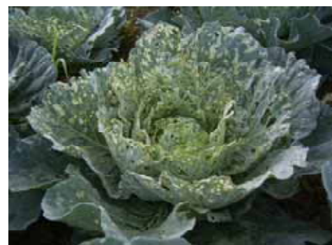
コナガによる食害