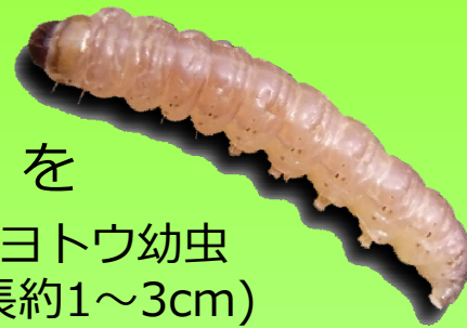
イネヨトウ幼虫 (体長約1~3cm)