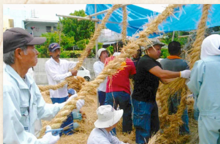
区民による綱作り

このように、地域住民が積極的に参画し、地域の伝統文化の継承を通じた「ふるさとづくり」に取り組んでいることから、「沖縄、ふるさと百選」の集落部門に認定された。