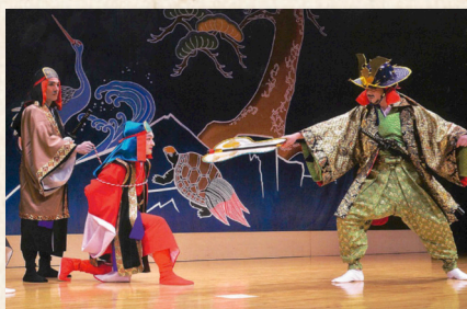
大遊びの演目「本部大主」