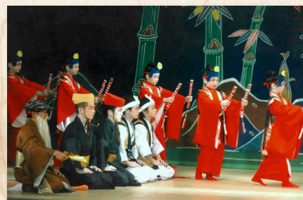
十五夜あしびの演目「長者又大主」