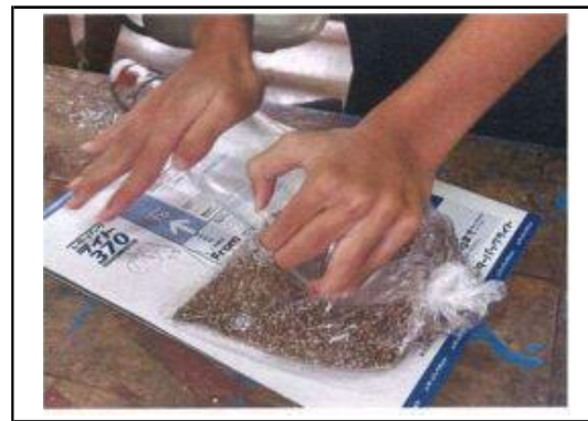
パクチーの播種準備