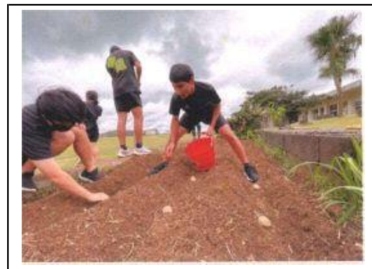
じゃがいもの植え付け体験