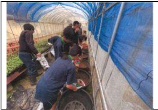
パクチーの植え付け体験