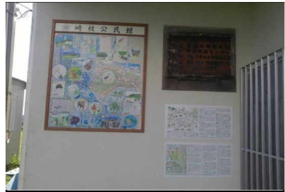
地域案内マップ看板設置