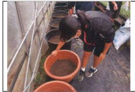
パクチーの植え付け体験