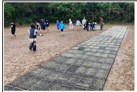
苗箱を広げる作業体験