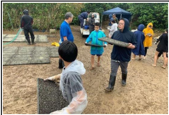
苗箱を広げる作業体験