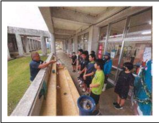
栽培体験の事前説明