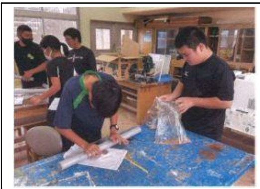
パクチーの播種準備