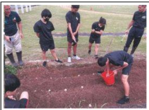
じゃがいもの植え付け体験