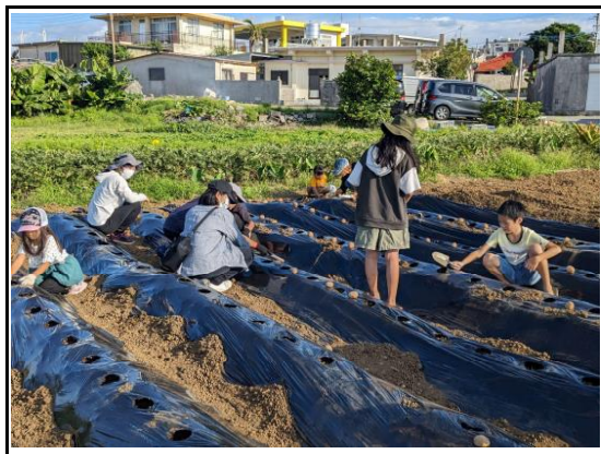
(耕作放棄地子ども農場活用： じゃがいも植付け①)