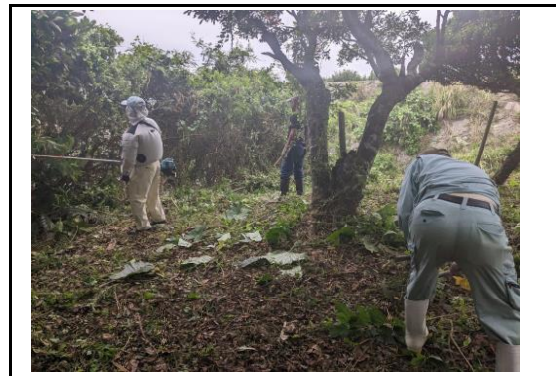
(土地改良施設周辺の整備・清掃②)