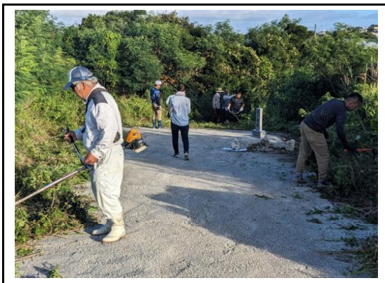
(土地改良施設周辺の整備・清掃③)