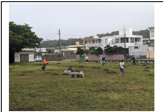
(土地改良施設周辺の整備・清掃①)