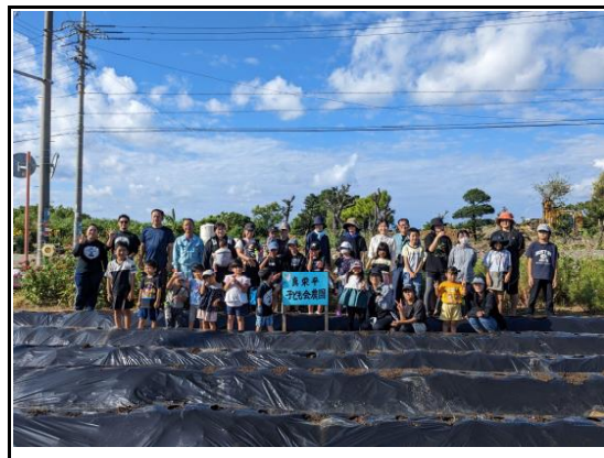
(耕作放棄地子ども農場活用： じゃがいも植付け②)