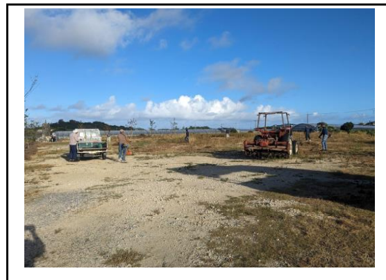
(土地改良施設周辺の整備・清掃④)

※16枚程度の写真は抜粋して、解説を記入する。その他の写真はデータで提供下さい。