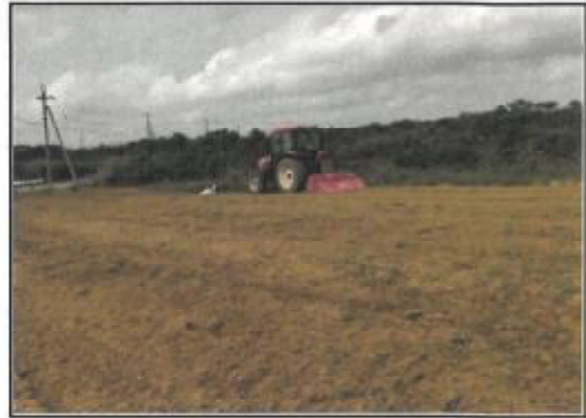
コスモス種蒔き前の耕運作業