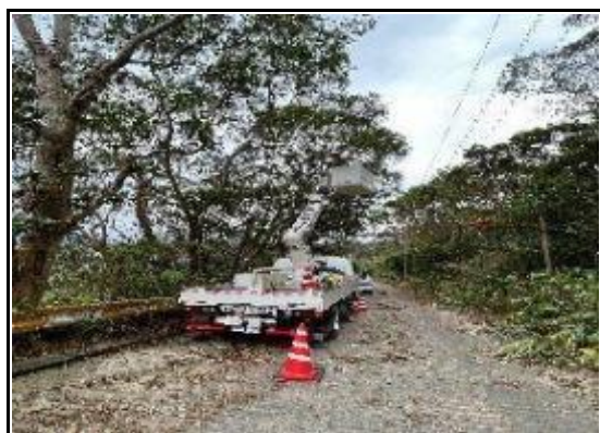
(高所作業車一準備)