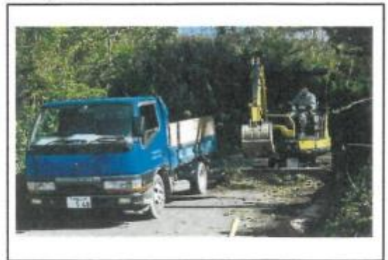
(農道沿いをユンボを使った整備) 12/3