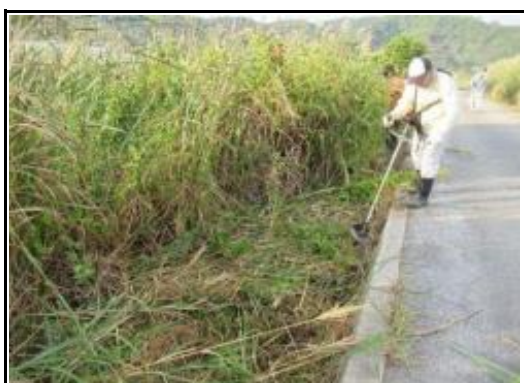
(草刈り／排水路土砂撤去)