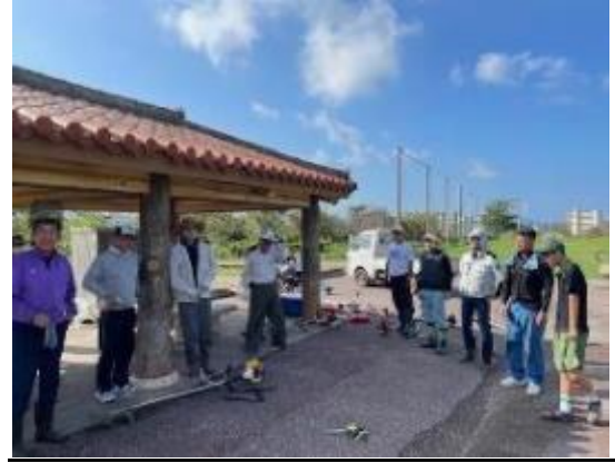
(作業前のミーティング風景2)