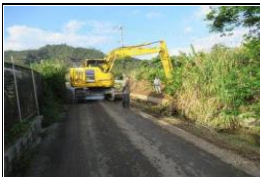
(草刈り／排水路土砂撤去)