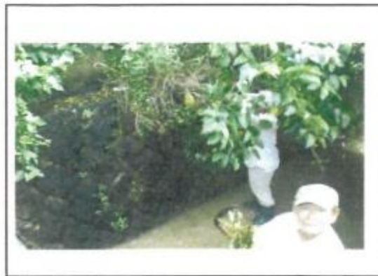
(1/21 シンナナ川周辺整備)