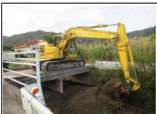
(草刈り／排水路土砂撤去)