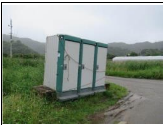
(オクラレルカ／仮設トイレ設置)