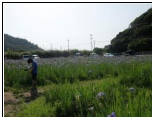
(オクラレルカ／来客状況写真)