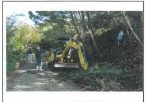
11/26 (合図森周辺の整備)