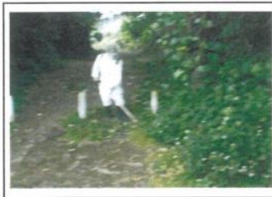
11/26 (拝所：大山周辺の草刈り)