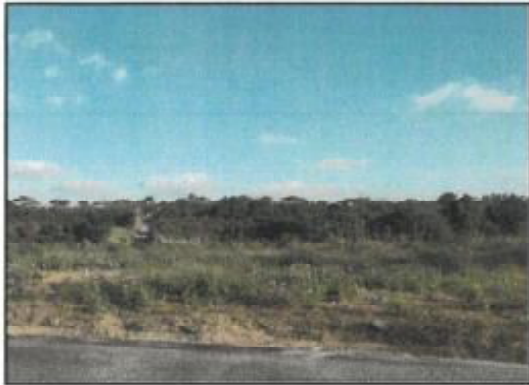
休耕地をコスモス畑に