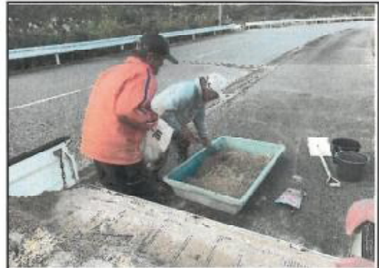
コスモス種蒔き準備