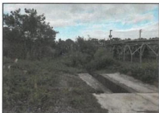
繁茂している農道