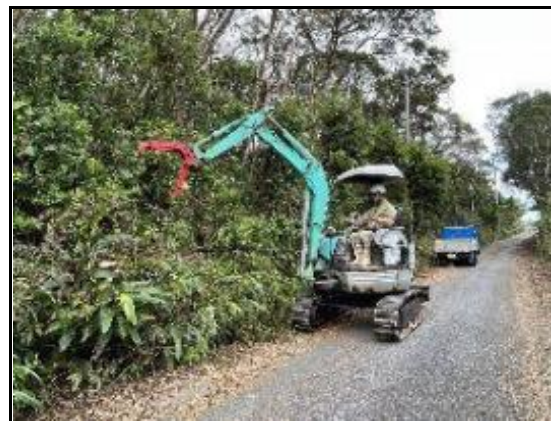
(土地改良区、枝の伐採)