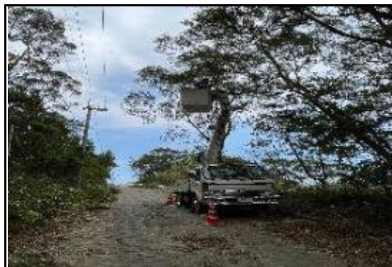
(高所作業車使用し伐採)