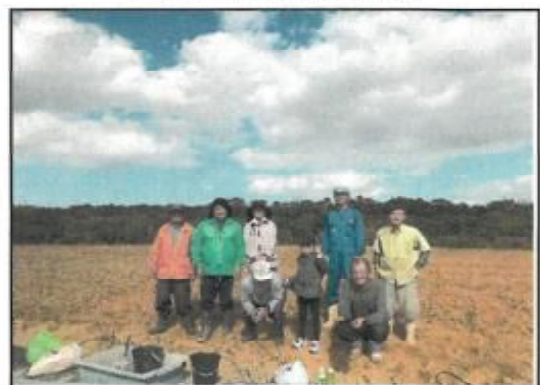
コスモス種蒔き作業メンバー

※16枚程度の写真を抜粋して、解説を記入してください。その他の写真はデータで提供願います。