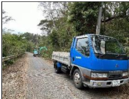
(土地改良区、枝の伐採)