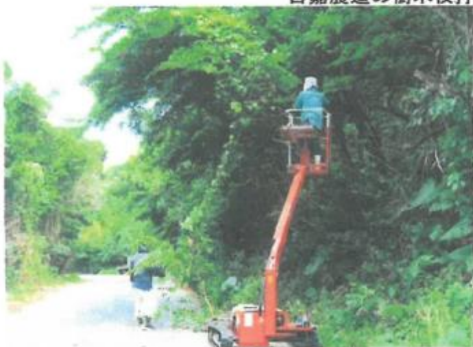
古嘉農道の樹木枝打ち作業 9月4日・5日・6日・実施