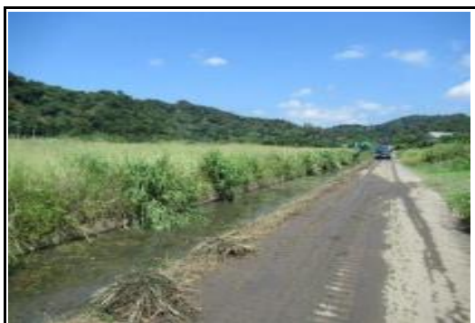
(草刈り／排水路土砂撤去)