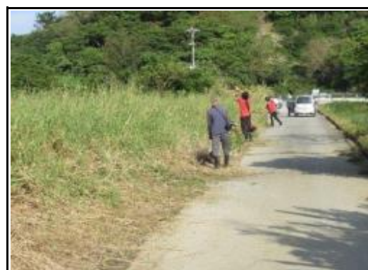
(草刈り／排水路土砂撤去)

※16枚程度の写真を抜粋して、解説を記入してください。その他の写真はデータで提供願います。