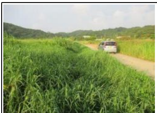
(草刈り前／排水路土砂撤去前)