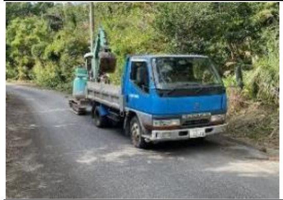
(刈り取った草、枝の積み込み)