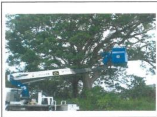
(11/18スカイマスターでガジュマル伐採)