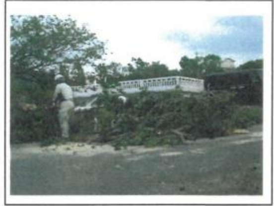
(11/18 チェンソーで幹を伐採)