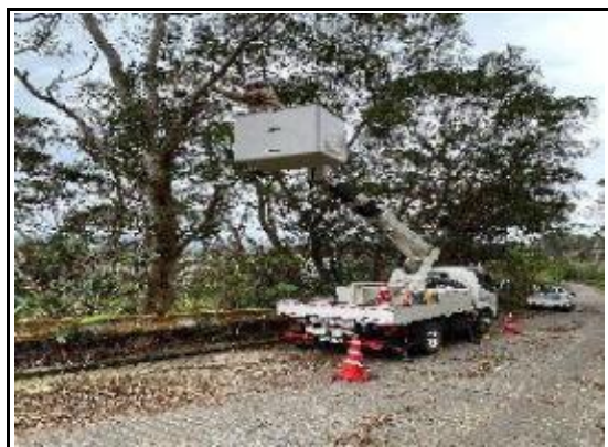
(高所作業車使用し伐採)