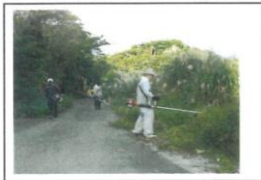
12/3 (農道沿いの草刈り)