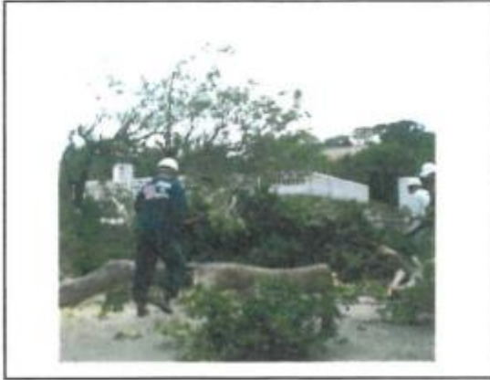
(11/18 チェンソーで幹を伐採)