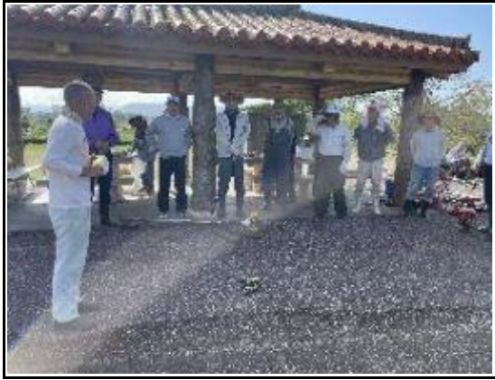
(作業前のミーティング風景1)