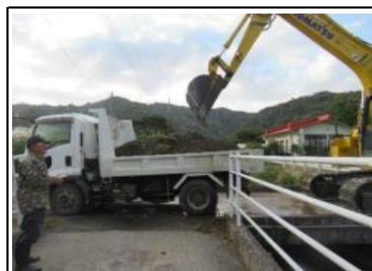
(草刈り／排水路土砂撤去)