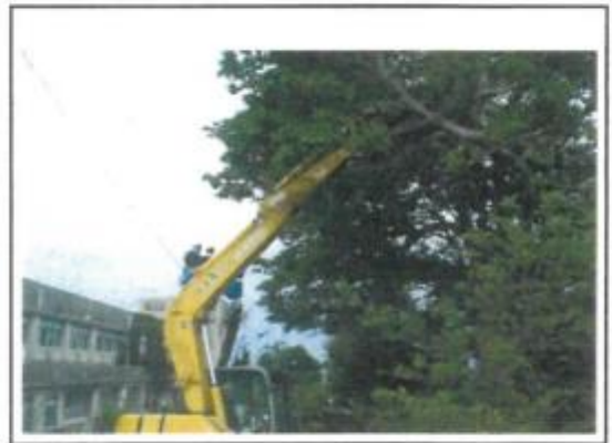
(11/18スカイマスターでガジュマル伐採)