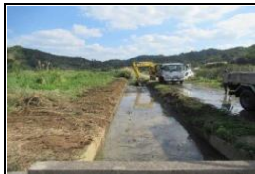
(草刈り／排水路土砂撤去)