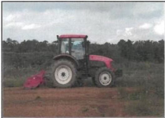
コスモス種蒔き前の耕運作業