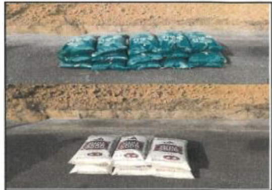
購入したたい肥と肥料