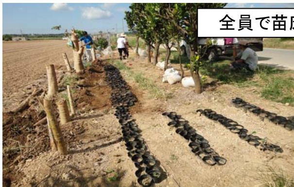
全員で苗床を整理