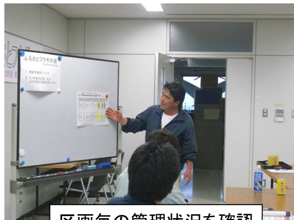
区画毎の管理状況を確認