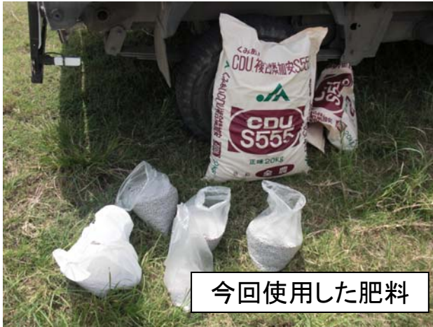
今回使用した肥料