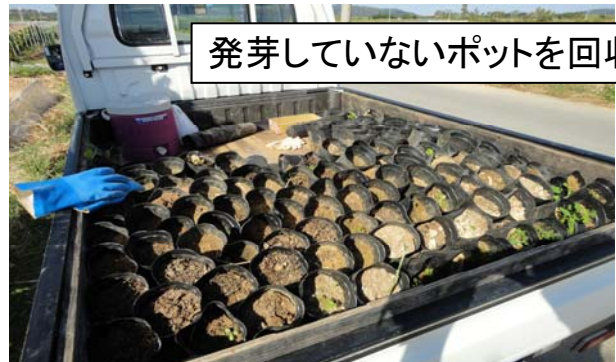
発芽していないポットを回収