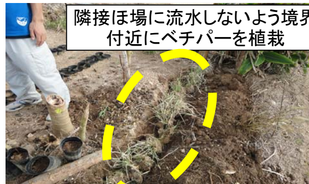
隣接ほ場に流水しないよう境界 付近にベチパーを植栽