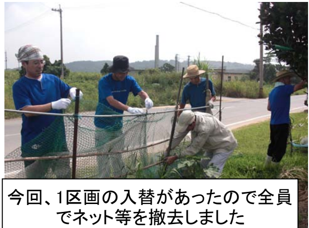
今回、1区画の入替があったので全員でネット等を撤去しました