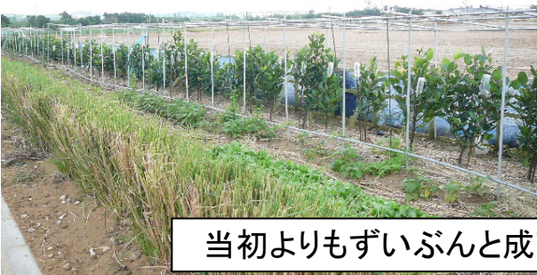
当初よりもずいぶんと成長しました^^ 平均樹高約100センチ!!