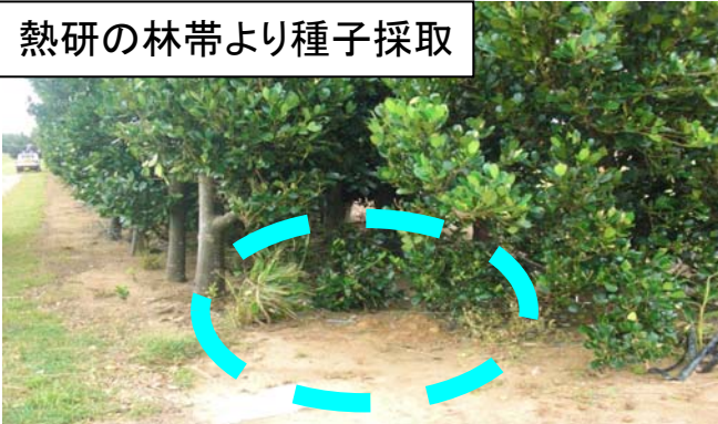
熱研の林帯より種子採取