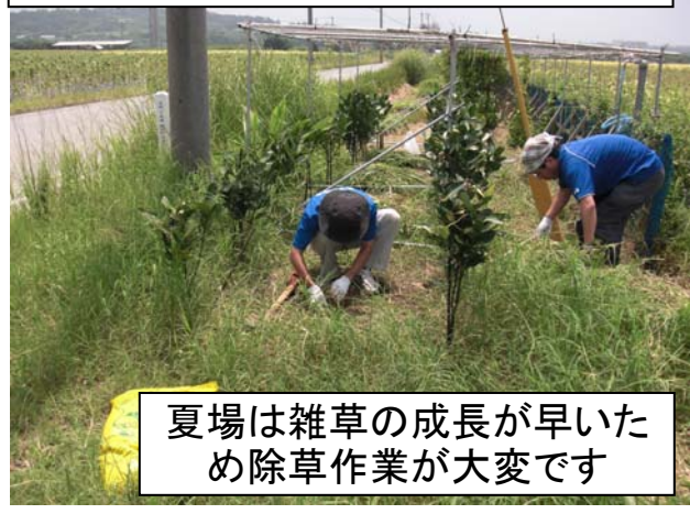
夏場は雑草の成長が早い ため除草作業が大変です