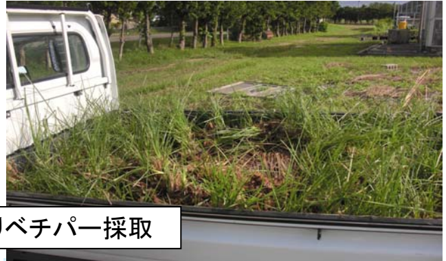
農研センターよりベチパー採取