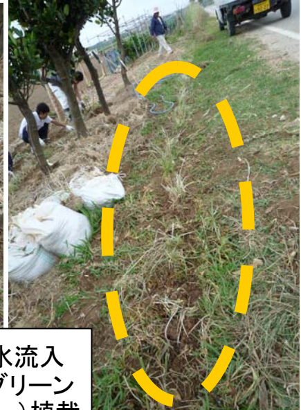
農道からの雨水流入 や北風を防ぐグリーン ベルト(ベチパー)植栽