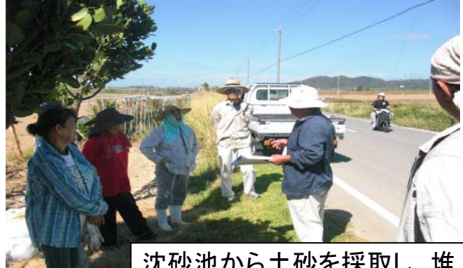
沈砂池から土砂を採取し、堆肥を交ぜて土づくり