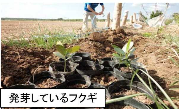
発芽しているフクギ