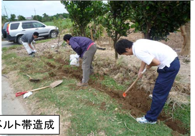
グリーンベルト帯造成