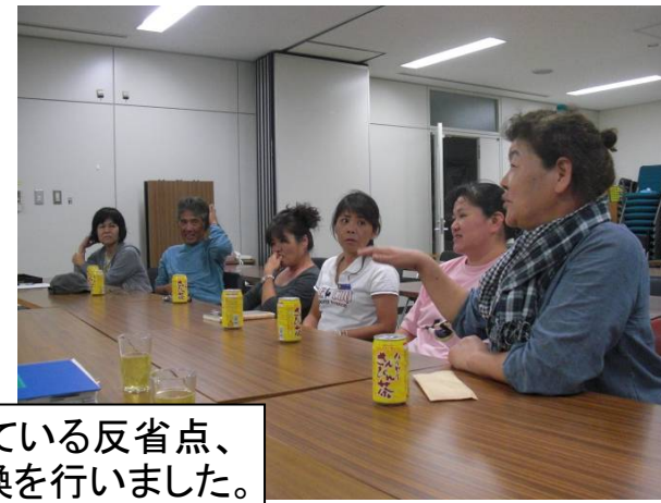
日頃皆様を感じている反省点、提案等の意見交換を行いました。