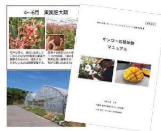
体験プログラムの開発・マニュアル化

グリーン・ツーリズムの受入品質を向上させるため、活動組織間の連携を強化し、ルール作りや研修会などの取組により、県下での「安全・安心」の対応を促す。また、グリーン・ツーリズム情報を一元化し、沖縄らしい体験交流プログラムの情報を発信する。