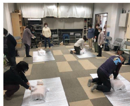
「グリーン・ツーリズムリスクマネジメント 研修会～救急蘇生法実習～」