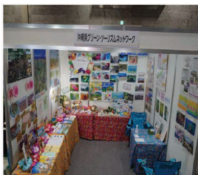
「グリーン・ツーリズムに関する 情報発信と県外プロモーション活動」