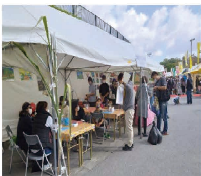
「花と食のフェスティバル ～都市農村交流情報コーナー～」

県内のグリーン・ツーリズムを推進するため、グリーン・ツーリズムネットワークを中心に、インストラクター等の人材育成及びフォローアップ研修、地域間連携に向けた取組を行うことで、グリーン・ツーリズム推進支援体制の構築等を一体的に行う。