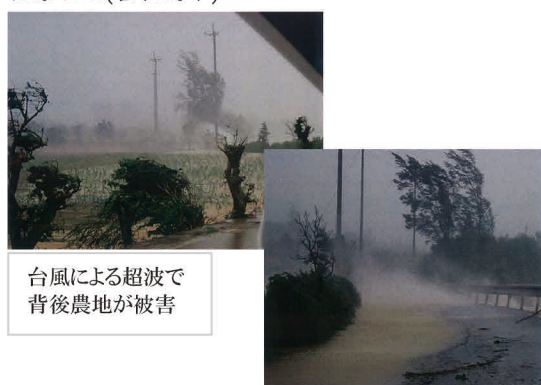
台風による超波で背後農地が被害