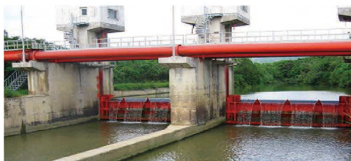
平喜名地区(石垣市)

国営土地改良事業で造成された一定規模以上を有する施設等(ダム・堰・揚水機場)についての維持管理に対する事業で、農業用水の安定的供給を図ることを目的として平成9年度から開始している。対象施設が8施設で、そのうち、底原ダム・平喜名堰・名蔵ダムは県が、その他は市町村が事業主体となっている。