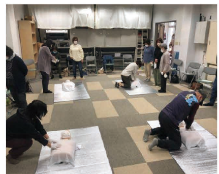
「グリーン・ツーリズムリスクマネジメント 研修会～救急蘇生法実習～」