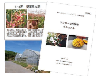
体験プログラムの開発・マニュアル化

グリーン・ツーリズムの受入品質を向上させるため、活動組織間の連携を強化し、ルール作りや研修会などの取組により、県下での「安全・安心」の対応を促す。また、グリーン・ツーリズム情報を一元化し、沖縄らしい体験交流プログラムの情報を発信する。