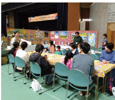
「花と食のフェスティバル ～都市農村交流情報コーナー～」

県内のグリーン・ツーリズムを推進するため、グリーン・ツーリズムネットワークを中心に、インストラクター等の人材育成及びフォローアップ研修、地域間連携に向けた取組を行うことで、グリーン・ツーリズム推進支援体制の構築等を一体的に行う。