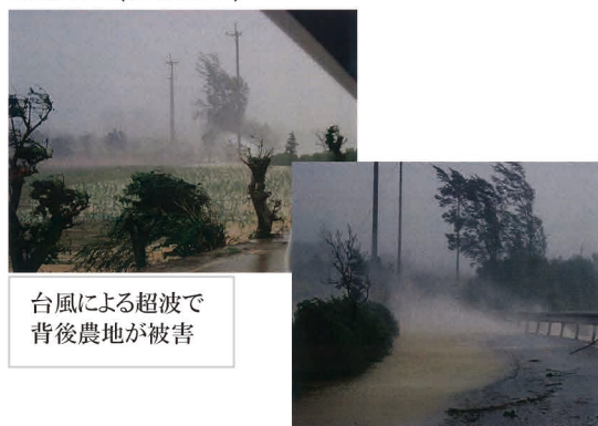
台風による超波で背後農地が被害