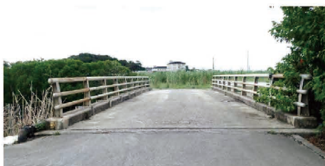
奥間第2地区（国頭村）

農村地域の農道網を計画的かつ有機的に整備・更新することにより、農産物流通の低コスト化と農村環境の改善・維持を図ることができる。今後は農道の機能保全対策面からの更新を中心とした整備を行っていく。