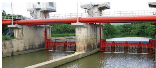
平喜名地区(石垣市)

国営土地改良事業で造成された一定規模以上を有する施設等(ダム・堰・揚水機場)についての維持管理に対する事業で、農業用水の安定的供給を図ることを目的として平成9年度から開始している。対象施設が8施設で、そのうち、底原ダム・平喜名堰・名蔵ダムは県が、その他は市町村が事業主体となっている。