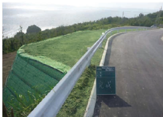
地すべり対策事業の実施状況及び要望