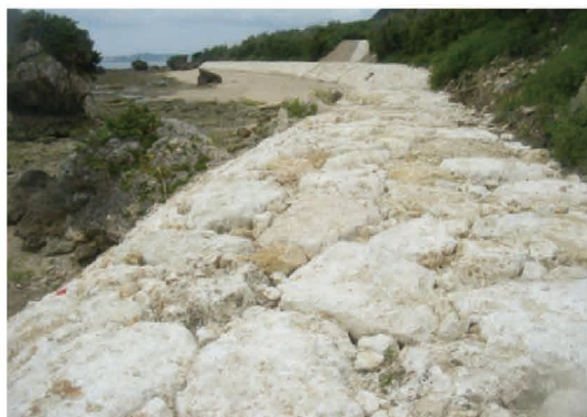
平安名3期地区（うるま市）

地すべり等防止法により指定された地すべり防止区域において、地すべりによる農地・農業用施設等の被害を除去・軽減するため、地表水の排除、地下水の排除、土留め工などを実施し、農地等を保全し、地域住民の生命・財産を守る。