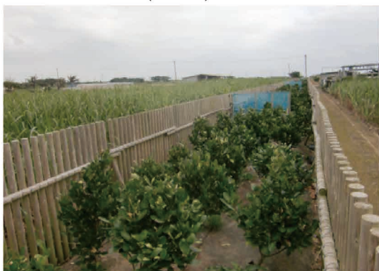
みやらがわ第1地区(石垣市)