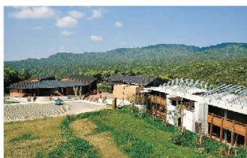
農山漁村体験施設