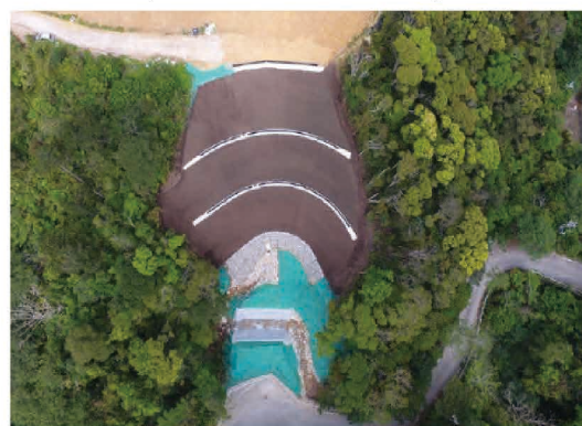
真喜屋地区(名護市、土砂崩壊防止工)