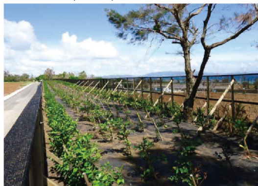
川平第1地区(伊江村)