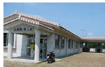
地域資源活用起業支援施設