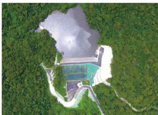
谷川地区(伊平屋村)