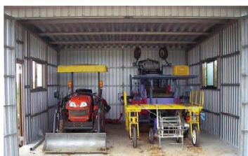
高生産性農業用機械施設