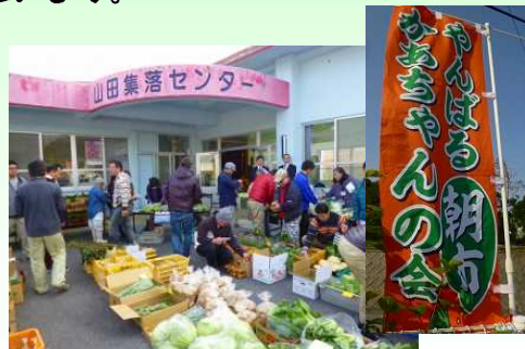
生産者と料理人を繋ぐ「山田朝市」

上記の活動が認められ、今回の受賞となりました。3月4日に東京で表彰式が開催されました。(担当:長山)