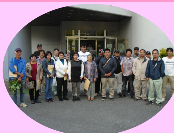
「いもの日」関連行事へ参加