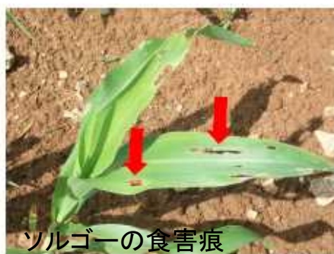
ソルゴーの食害痕