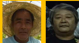
安富 慧 (洋ラン) 平藤普通 (繁殖牛)