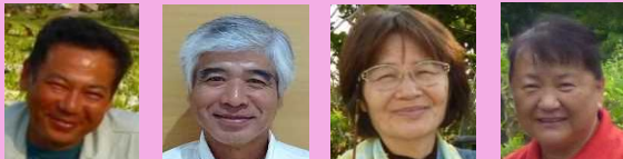
具志堅 カ (キク) 高良 久 (柑橘・野菜)