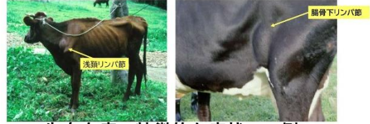
牛白血病の特徴的な症状の一例