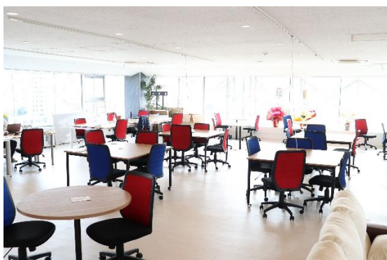
◆ 8階フリースペース

これにより、弊社の課題であった、人材不足による案件の失注、また、 沖縄県の課題でもある、IT 人材不足の解決を、ビジネスの視点から目指していきます。