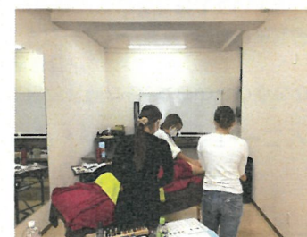
「Fitness Life stylist」