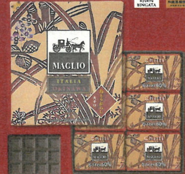
島とうがらし「大辛口」

唐辛子は中世より恋に効くと言われてきました。糸満産島唐辛子の情熱の赤色と刺激的な辛みが特徴です。