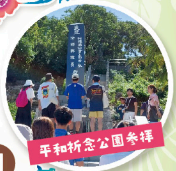
平和祈念公園参拝