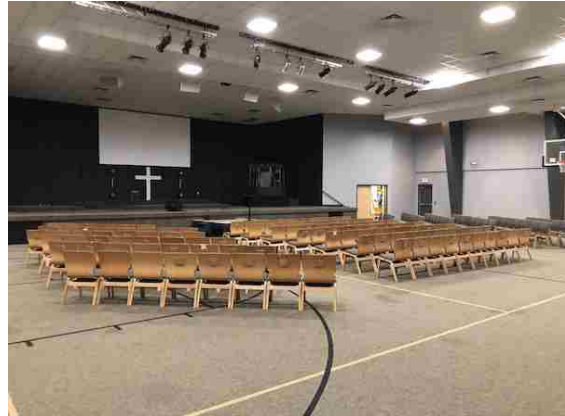
ホール室内の様子