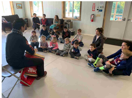
平田氏による次世代ワークショップの様子