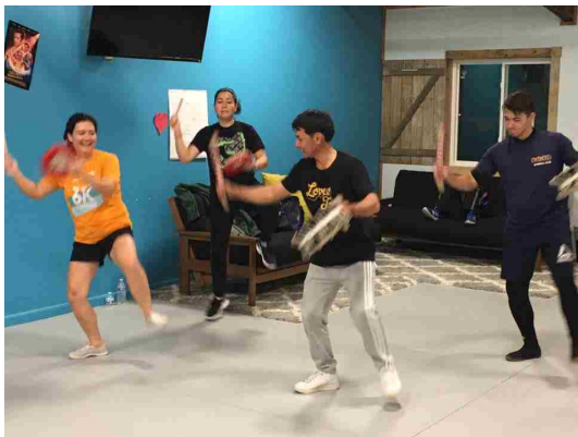
諸見里青年会によるエイサー指導の様子