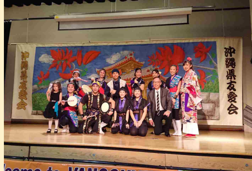
バンクーバー公演での記念撮影