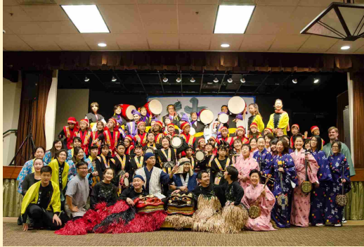
シカゴ公演での記念撮影