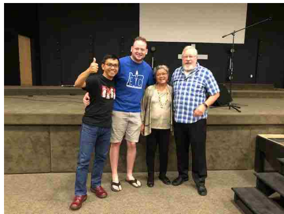
ジューン会長夫妻と会場・音響スタッフ