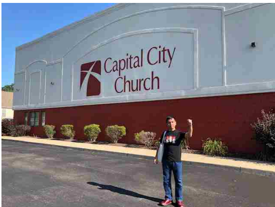
本番会場の外観を他の角度から