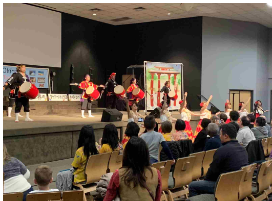
本番当日のイベントの様子