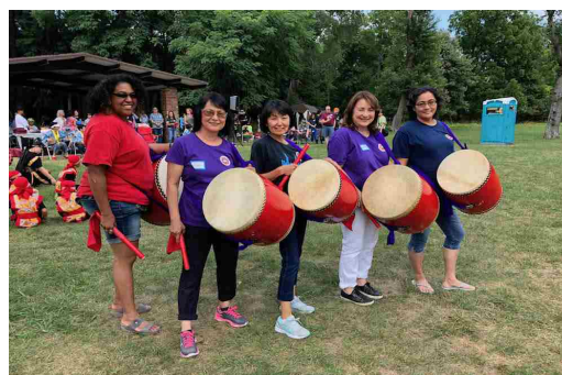
次世代への継承を目指す 県人会所属の祭りエイサー太鼓グループ