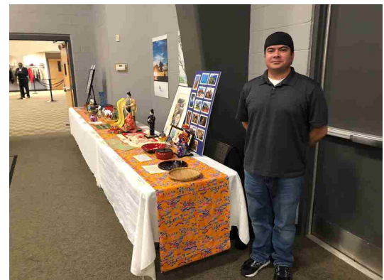
会場レイアウトにも凝ってます