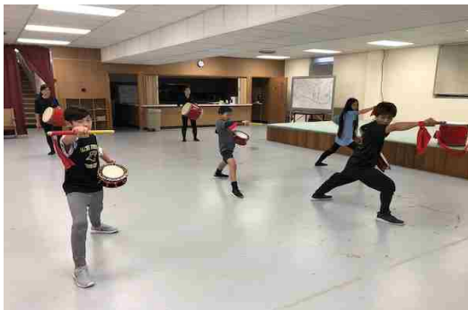
ハイレベルなエイサー指導の様子