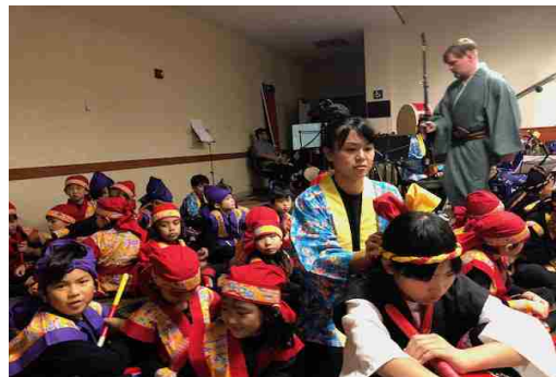
緊張感たかまる本番直前の楽屋