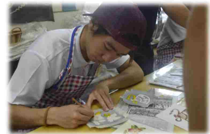
↓ 伝統工芸(紅型)体験