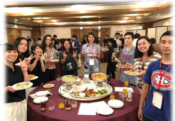
↑ ウェルカム・パーティー ↓