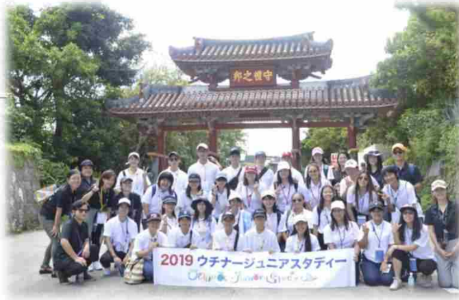
↑ 首里城見学 ↓