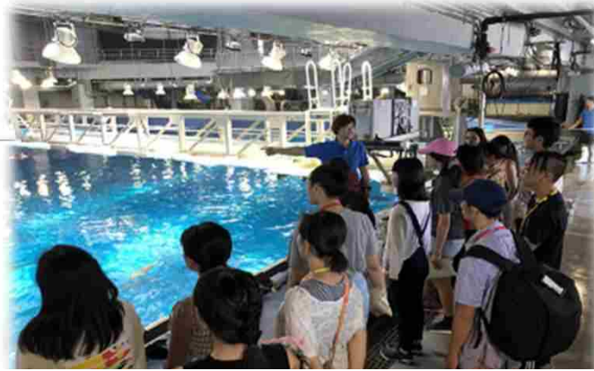
↑ バックヤードツアー イルカショー見学 ↓