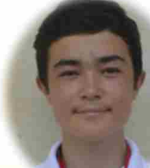
オーストラリア ホーキンス 海