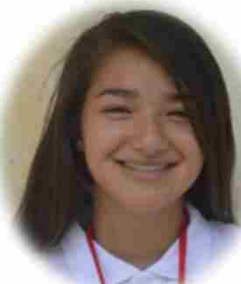
ワシントンDC 芽生 ホーメン