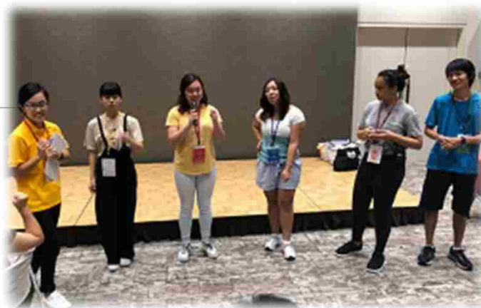
↑ 移民・移住学習 ↓