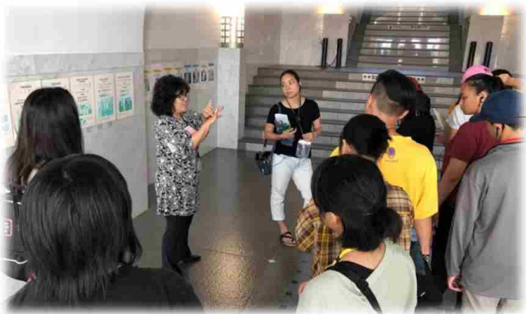
↑ 平和祈念資料館見学 ↓