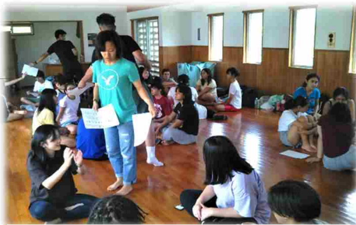
↑ 中間振り返りWS ↓