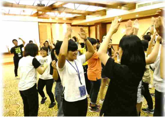
↑ 交流プログラム ↓