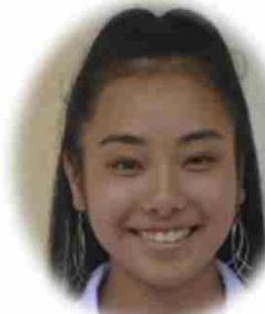
カリフォルニア ステファニー 茉代 守次富