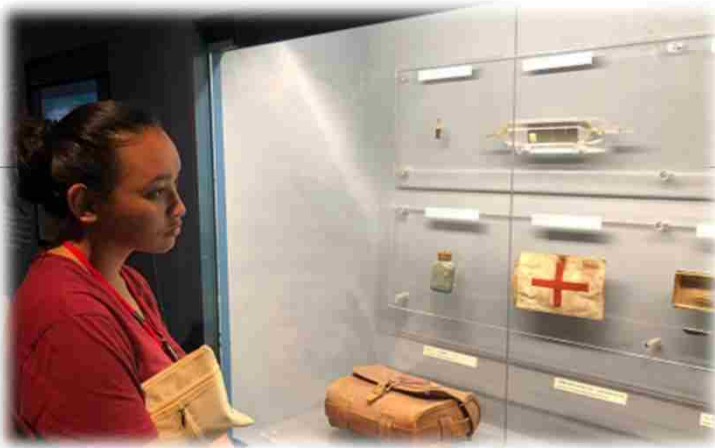
↑ ひめかじ平和祈念資料館 ↓