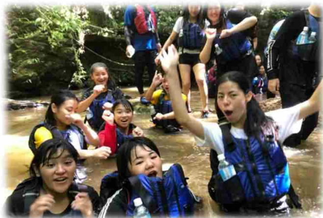
↑ 東の沢トッキング ↓