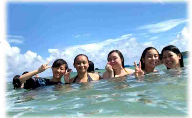
↑ ビーチアクティビティ ↓