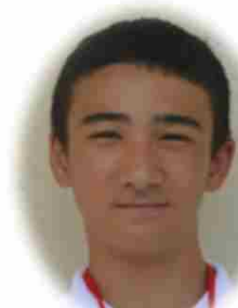
カナダ カーナー シイファイヴ