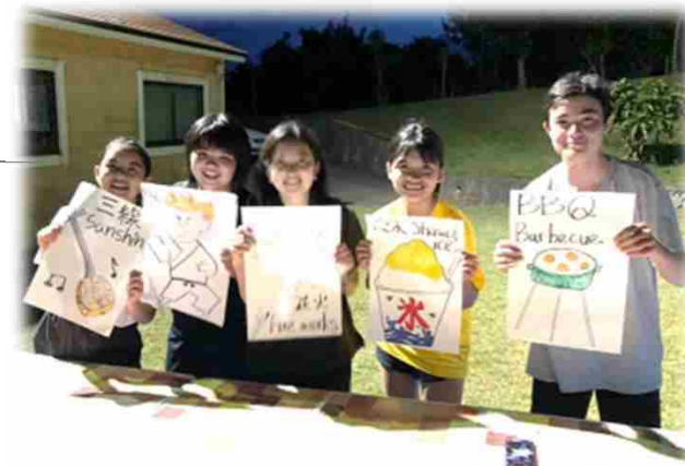
↑ 交流プログラム ↓