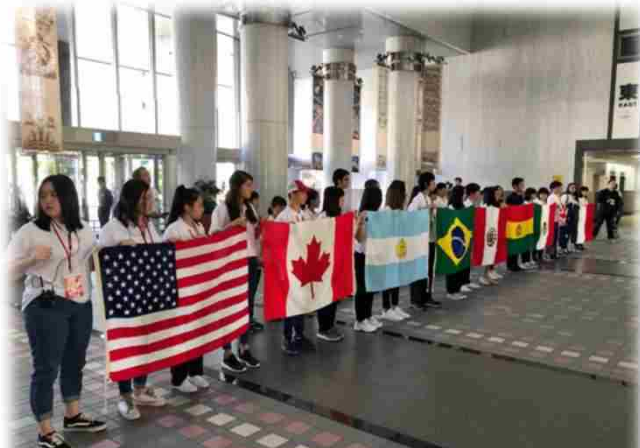
↑ 歓迎せしモニー ↓