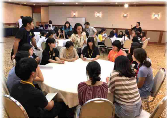
↑ 移民・移住学習 ↓