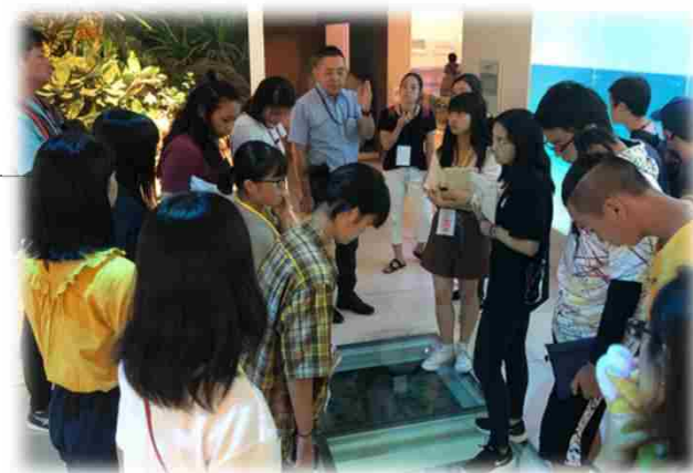
↑ 県立博物館見学 ↓