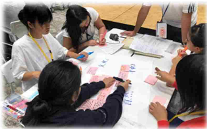
↑ 移民・移住学習 ↓