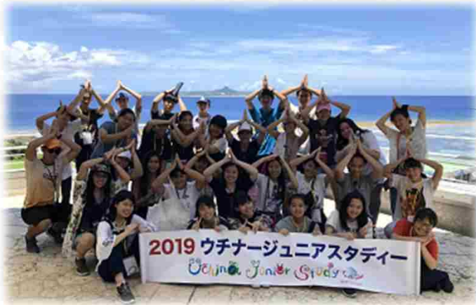
↑ 水族館見学 ↓