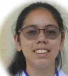
ペルー 伊苺 楓 ミラグロス