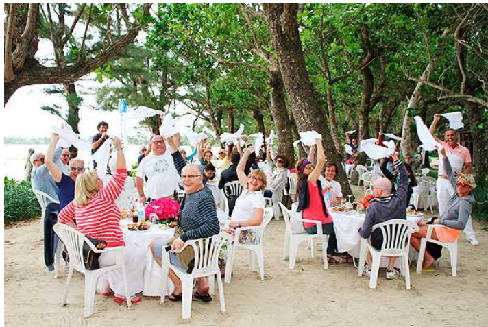
石垣島のバーベキューを楽しむインセンティブトラベル客

広大な海域に散在する160の島々があり、どの島も個性豊かで、離島ならではの大自然、島民とのふれあい、そこでしか味わえない様々な体験は、非日常で特別な時間を演出してくれます。