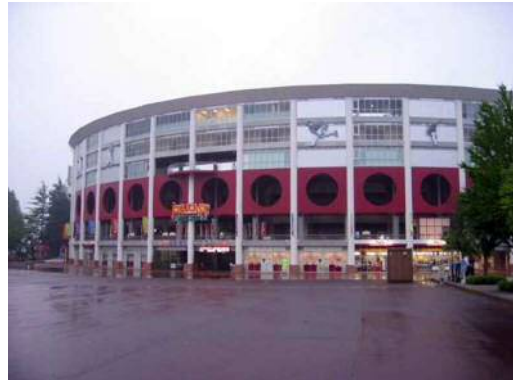
日本製紙クリネックススタジアム宮城

宮城県仙台市の宮城野原公園に位置する野球場で、当初は1950年に整備された地方球場の一つであった。しかし、2004年の東北楽天イーグルスのプロ野球参入に伴い、大規模な改築が行われ、日本におけるボールパークの先駆的な存在として生まれ変わった。