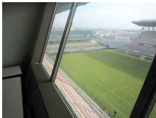
上部からはフィールド全体を見渡せる