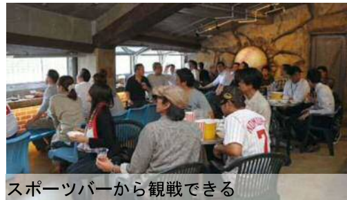
スポーツバーから観戦できる