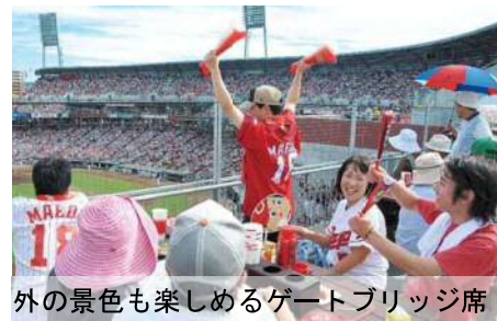
外の景色も楽しめるゲートブリッジ席