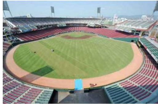
マツダズームズームスタジアム