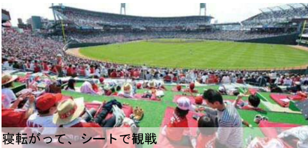
寝転がって、シートで観戦