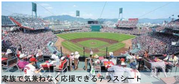
家族で気兼ねなく応援できるテラスシート