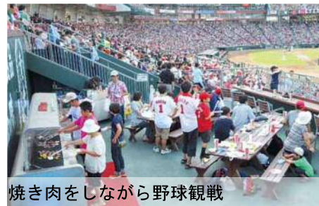
焼き肉をしながら野球観戦