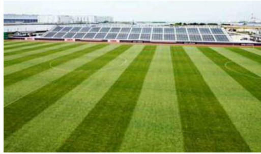
メインフィールド

他に人工芝のサッカーフィールドが 8 面あり FIFA 公認人工芝を使用し、このうち、2 面には照明設備を設置している。