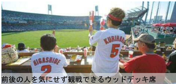
前後の人を気にせず観戦できるウッドデッキ席