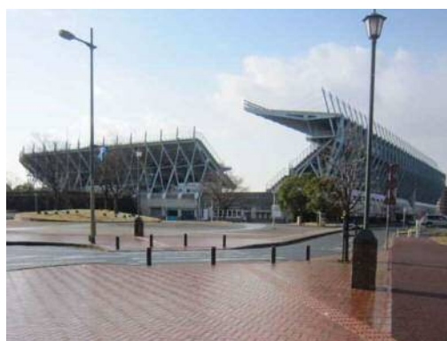
屋根の構造が特徴的