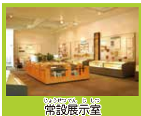
ひびきつてん、じしつ 常設展示室

豊かな自然と海に囲まれた沖縄県は 先史時代・ブスク時代・近世・近代を経て 現在に至る生活の跡が地中などに埋もれています。 この生活の跡（遺跡）には、当時の人々の生活の道具など（遺物）がたくさん見つかります。このような遺跡や遺物を埋蔵文化財といいます。この埋蔵文化財の調査や研究・保存・活用为中心的な施設が、2000（平成12）年4月1日にオープンしました。それが「沖縄県立埋蔵文化財センター（埋文センター）」です。