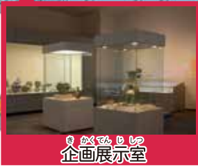
きかくしつ 企画展示室