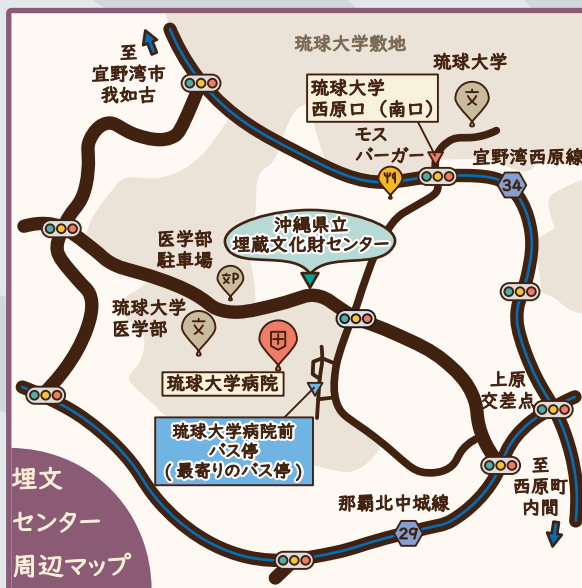
埋文センター 周辺マップ