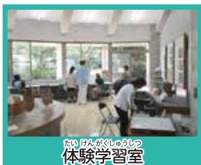
かいぶんがくしつ 体験学習室

県内の遺跡から出土した資料を展示し、先人たちの道具や暮らしについて、時代ごとに紹介しています。