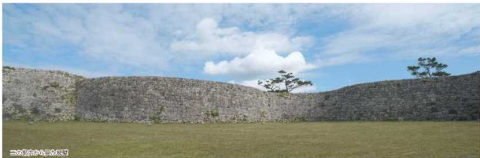
三の郭内から見た城壁