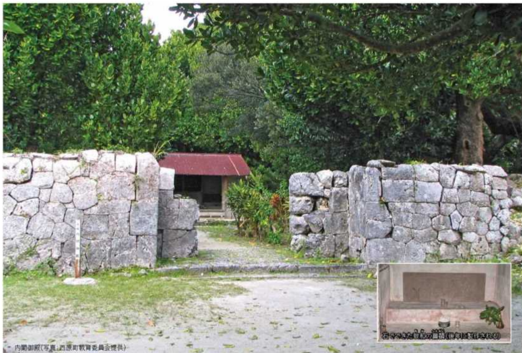
内間御殿