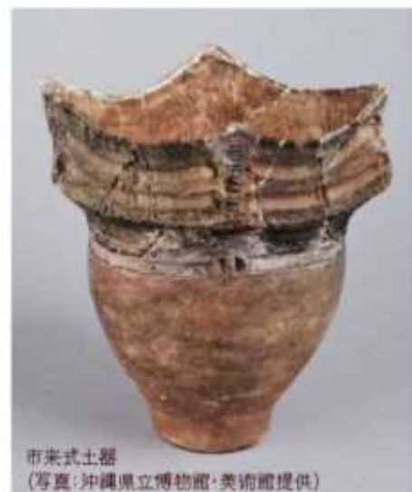
市来式土器

また、1971(昭和46)年に国道330号の建設に伴い取り崩されそうになりましたが、保存運動の成果によって貝塚の下にトンネルを通すことで保護されています。