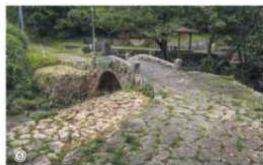
①～③中頭方西海道(安波茶橋) ④～⑥普天満参詣道(当山の石畳道・当山橋)

中頭方西海道及び普天満参詣道は、ともに首里王府が幹線道路として整備したもので、現在も石畳道や*石缸(石橋)の*遺構が状態良く残っており、琉球国時代の交通の歴史を知る上で貴重です。