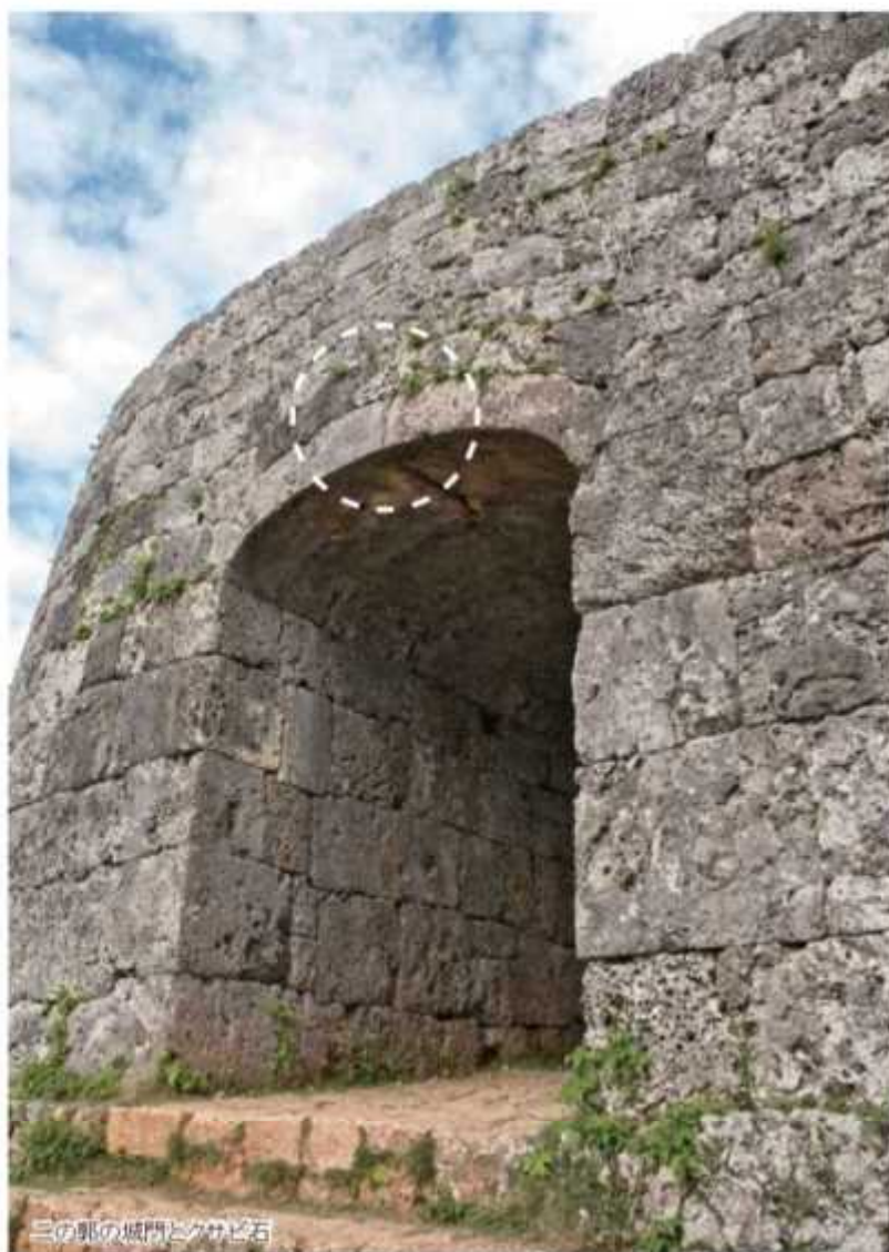
三の郭の城門とカサド石