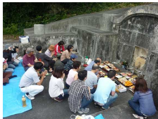
しーみーさい ⑪清明祭