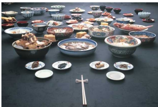
うかんしんりょうり ⑱御冠船料理