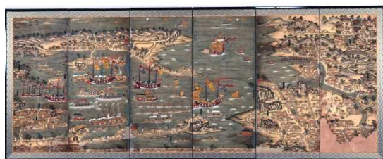
りゅうきゅうこうえきこうずびようぶ ⑧琉球交易港図屏風