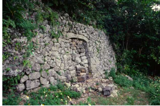
いそ たかうはか ②伊祖の高御墓