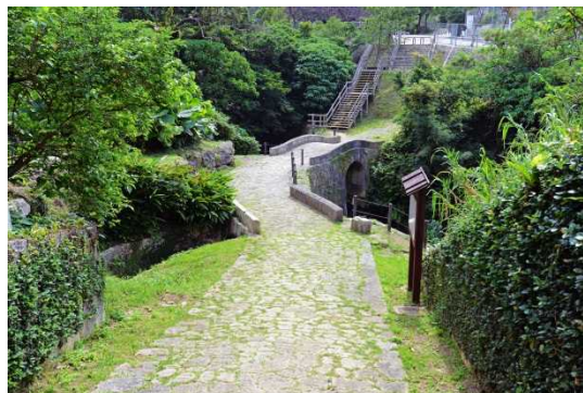
なかがみほうせいかいどう しょうねいおう みち ⑦中頭方西海道 (尚寧王の道)