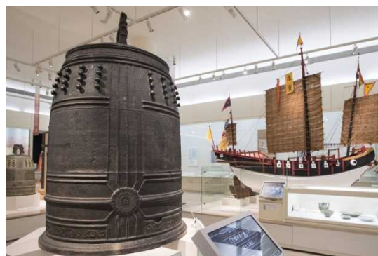
きゅうしゅりじょうせいでんしょう ばんこくしんりょう かね ⑨旧首里城正殿鐘 (万国津梁の鐘)