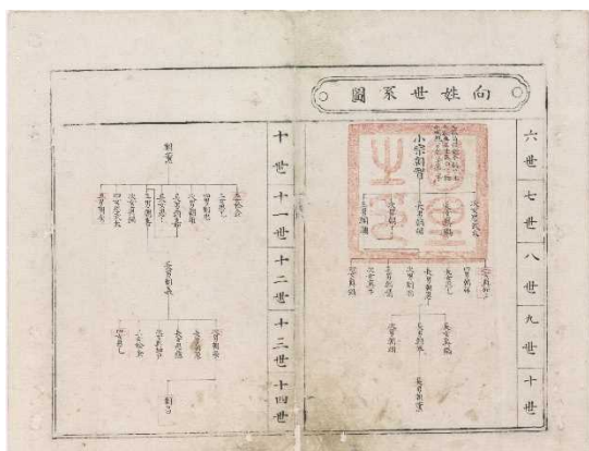
しょうせいかふ へとなけ ㉒ 向姓家譜 (邊土名家)