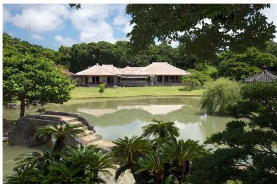
しきなえん ②識名園