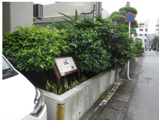
てんしかんあと ⑰天使館跡