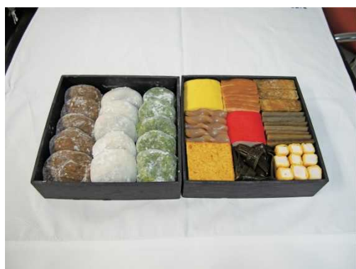
⑫ウサンミ (お供え物)