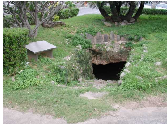
まきみなと ④牧港テラブのガマ