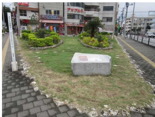
くめむらしゅうへん しせき きゅうせき ⑩久米村周辺の史跡・旧跡