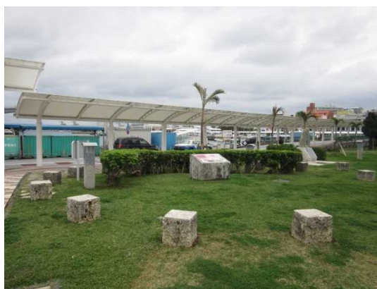
なほこうしゅうへん きゅうせき ⑬那覇港周辺の旧跡