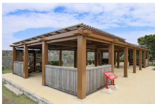
しゅりじょう ぜにくらあと ⑥首里城 錢蔵跡