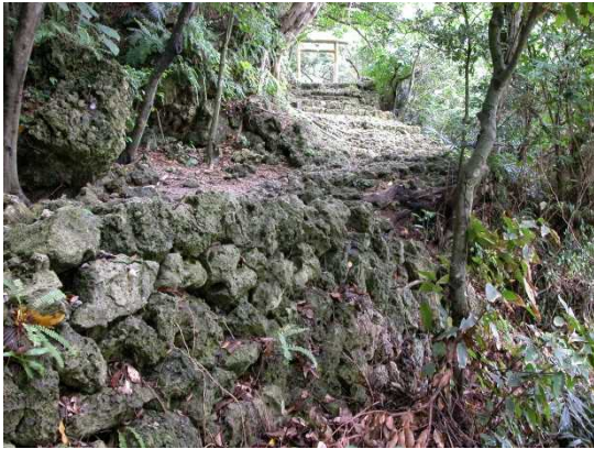
いそじょうあと ①伊祖城跡