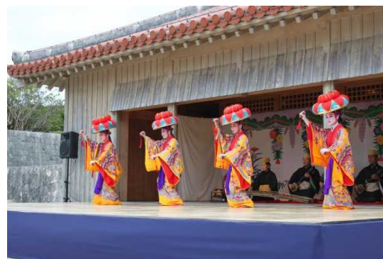
りゅうきゅうぶよう ⑲琉球舞踊