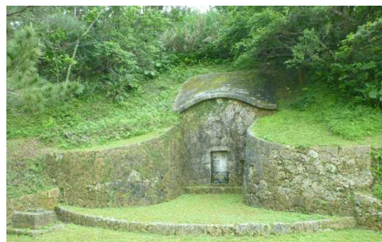
たまぐすくちょうくん はか へんとな はか ㉑玉城朝薫の墓 (邊土名家の墓)