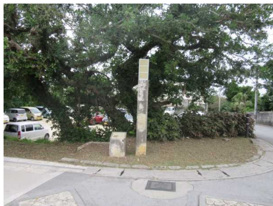
うちやうどらあと ③御茶屋御殿跡