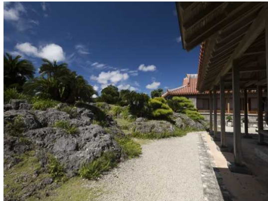
しゅりじょうしょいん さすのまていえん ㉑ 首里城書院・鎖之間庭園