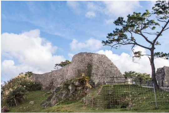
うらそえじょうあと ③浦添城跡