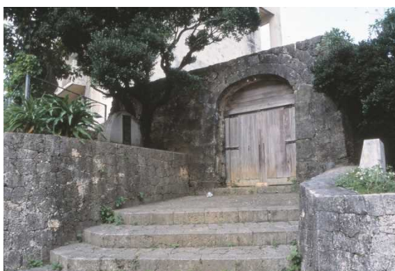
かみてんぴぐうあと いしもん ⑭上天妃宮跡の石門