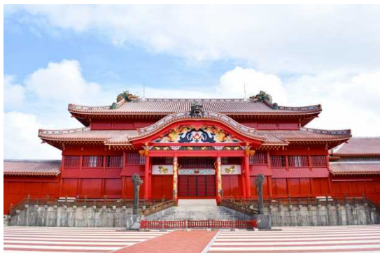
しゅりじょうあと ⑯首里城跡