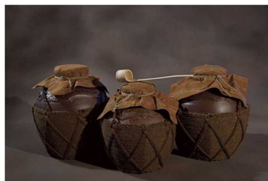
りゅうきゅうあわもり ⑤琉球泡盛