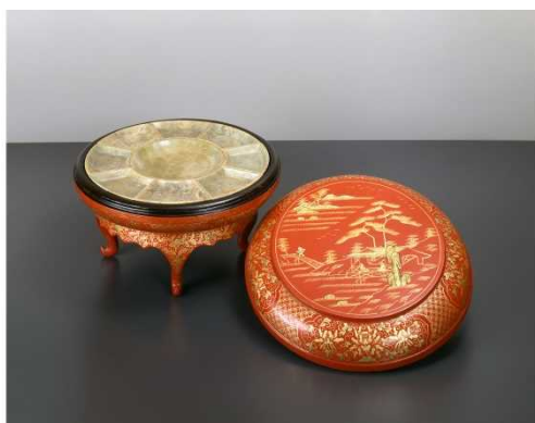
しゅうるしさんすいじんぶつはく え とうんだいぶん ④朱漆山水人物箱絵東道盆