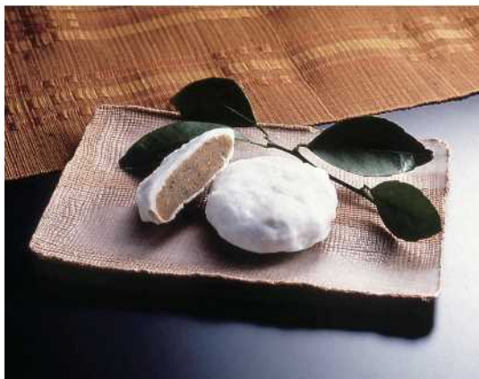
きっぱん ⑳ 桔餅