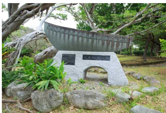
くめむら600ねんきねんひ ⑮久米村600年記念碑