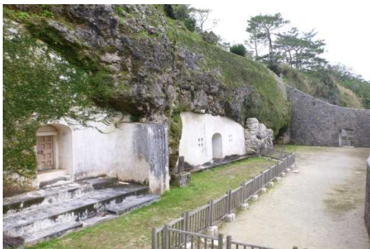
うらそえ ⑤浦添ようどれ