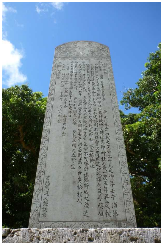
うらそえじょう まえ ひ ⑥浦添城の前の碑