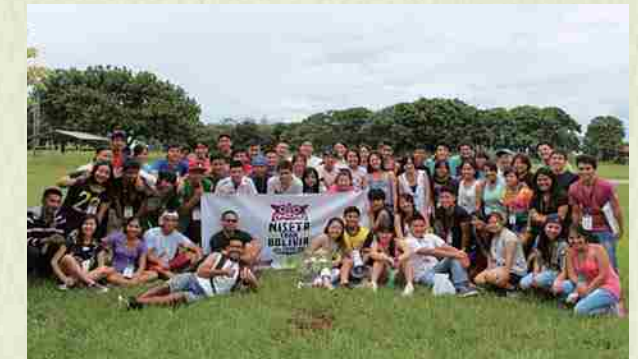
En Colonia Okinawa.