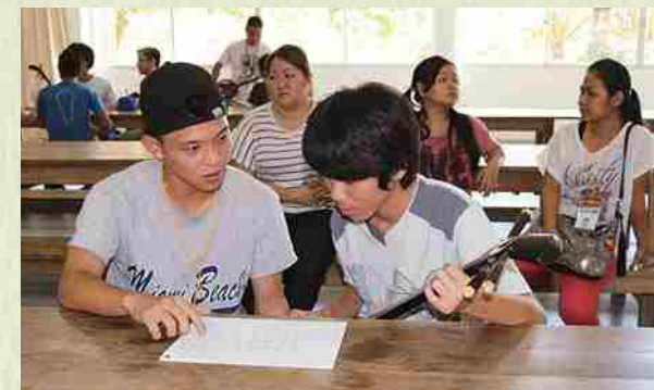
Socializamos a través del aprendizaje del shashin como arte tradicional okinawense.