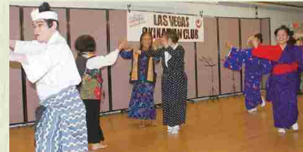
Final de la festividad por el año nuevo 2014.

Realizamos 2 eventos al año: el picnic de primavera y el "shinnenkai" de invierno (fiesta de año nuevo). Contamos con un grupo de sanshin y uno de danzas okinawenses que se reúnen regularmente para realizar las prácticas. Como resultado, organizamos eventos junto con otros grupos nikkei y tenemos actividades de intercambio con kenjinkais de otros estados y comunidades regionales.