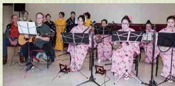
“Shinnenkai” 2015 Este año estudiantes extranjeros del bachillerato internacional se juntaron con nuestros cantantes y presentaron un lindo espectáculo. El número de sanshin es muy popular.