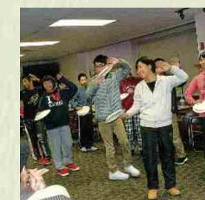
Octubre de 2015 Cena de bienvenida a estudiantes provenientes de Haebaru en Canadá.