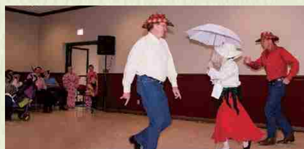
“Shinnenkai” 2015 Versión texana del “Modori Kago”. El público se rió a carcajadas.