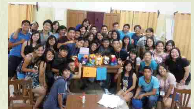
A través de la elaboración en grupos de amuletos shisa, realizamos el aprendizaje de la artesanía tradicional.