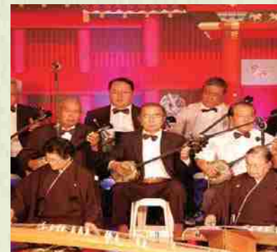
Presentación musical por Nomura Ryu Ongaku Kyokai do Brasil y otros grupos.