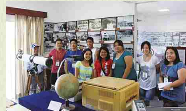
Foto conmemorativa en el Museo Histórico Okinawa Bolivia en Okinawa Uno.