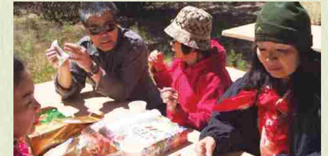
Foto de picnic 2015: A través de un BBQ afianzamos nuestras relaciones de amistad.