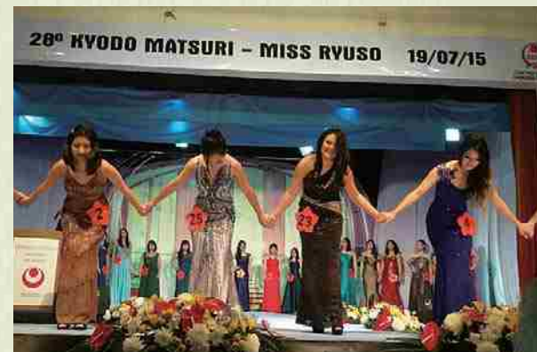
Kyodo Matsuri-Miss Ryuso 2015.