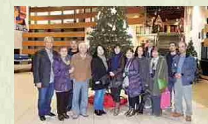
Asamblea general del kenjinkai justo antes de navidad.