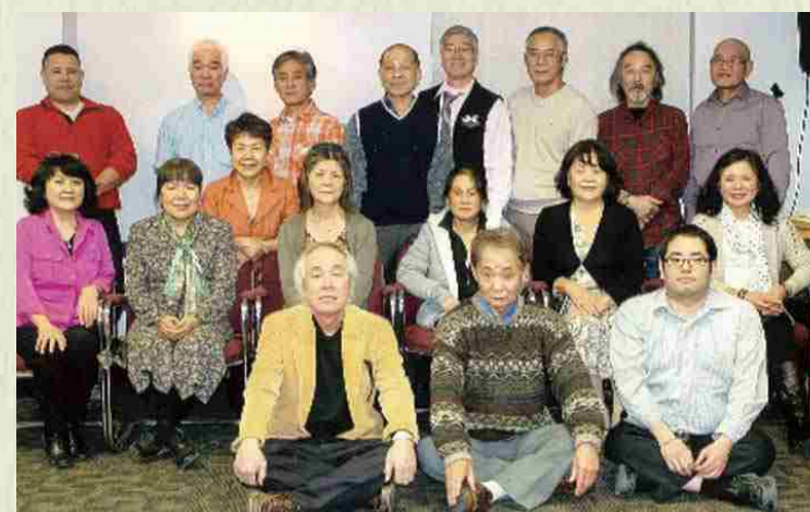
Enero de 2015 “Shinnenkai” (Reunión por Año Nuevo).

Fundado en 1982. Contamos actualmente con 20 familias y 57 personas registradas.