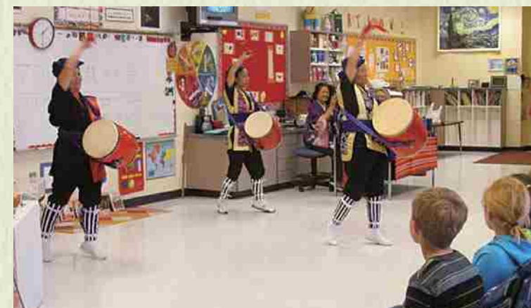
Enero de 2014 En la Asociación Japonesa nos asignaron un estand y realizamos una presentación de "Ryubu" (danza okinawense). Niños locales de edad escolar nos espectaban con mucho entusiasmo.

Visita a una escuela local. Nos esforzamos en mostrar a los niños la cultura de Okinawa y del Japón.