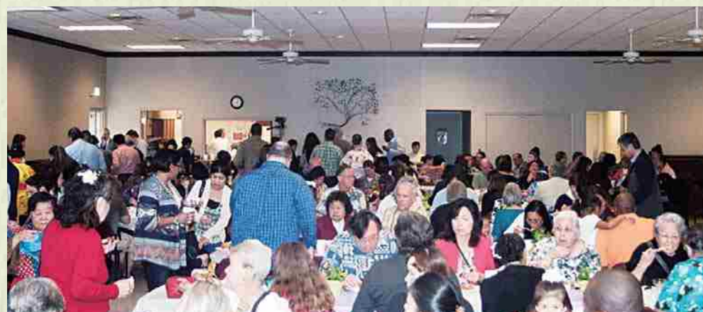
Cada persona trajo un platillo, compartimos un momento grato conversando y presenciando el show.