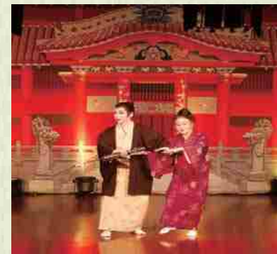
Teatro okinawense 2015.