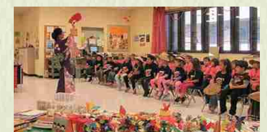
Marzo de 2014 En la escuela primaria S.S Dickenson bailamos el eisa y danzas japonesas en frente de todo el alumnado (aprox. 700 personas). Presentamos el origami.