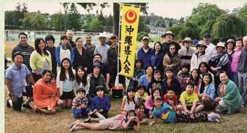
En el picnic de verano hablamos sobre las recientes noticias. Había mucho que conversar.

Comenzamos nuestras actividades en 1975. Socializamos en un ambiente de camaradería.