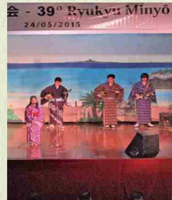
Concurso de canciones okinawenses.