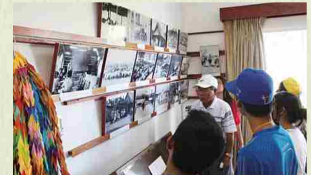
Aprendizaje sobre migración: En el Museo Histórico Okinawa Bolivia, en Okinawa Uno, transmitimos de la primera a las siguientes generaciones sobre las raíces ligadas a Okinawa.