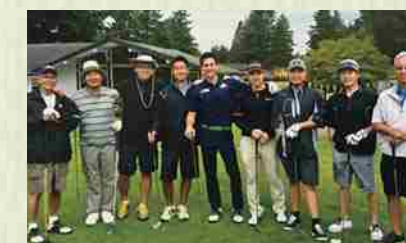
Reunión de confraternidad mediante un juego de golf.