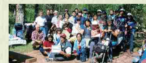
Agosto de 2015 Picnic en el Parque Fish Creek.