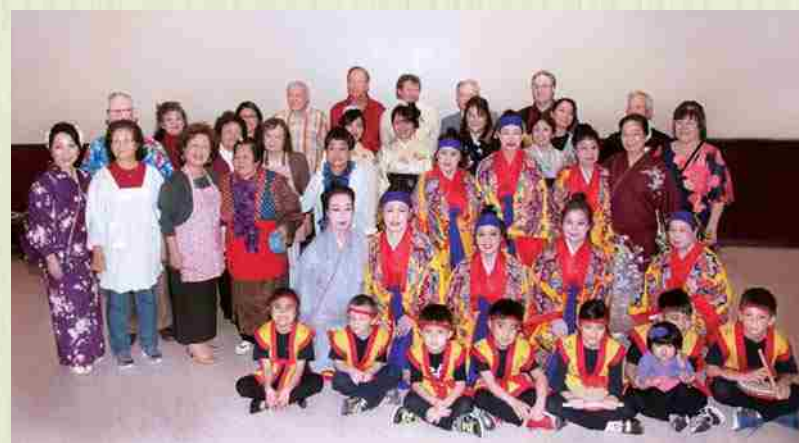
Foto con los participantes del “Shinnenkai” 2015. Todos los años los miembros y sus familiares, así como sus amigos se reúnen en un número aproximado de 200 personas.

¡Todos los años realizamos un “shinnenkai” (fiesta de año nuevo) con aprox. 200 participantes! Los diferentes números artísticos como el eisa y las danzas okinawenses son del agrado del público.