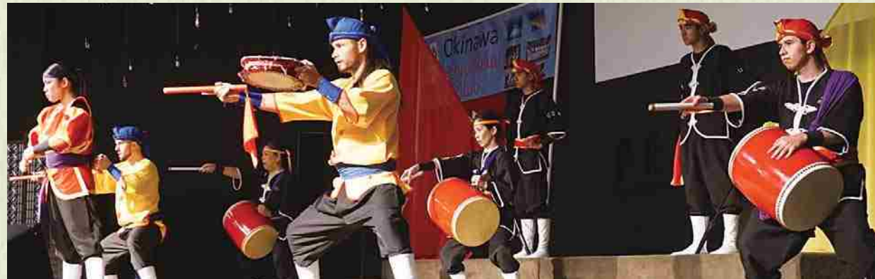
En la celebración por el 20º aniversario, presentación del grupo Texas Ryukyu Matsuri junto con miembros del Tomonokai.

¡En marzo de 2015 cumplimos 20 años! Nos esforzamos en dejar como herencia la cultura de Okinawa.