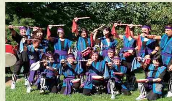
Festival de Japón 2015 Grupo de eisa conformado por amigos de primera, segunda y tercera generación.