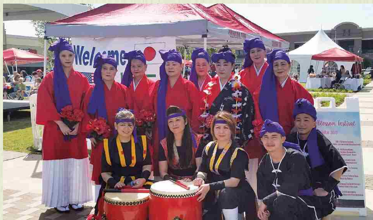
Presentación conjunta del grupo de eisa y el de danzas durante la "Sakura Matsuri" (Fiesta de la Flor de Cerezo) en Tuscaloosa, Alabama.