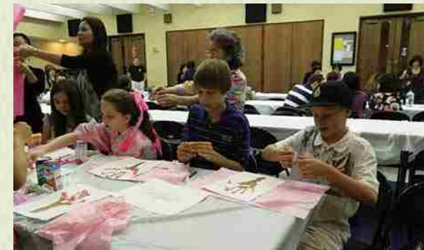
"Shinshunkai" 2014 Obaachan (primera generación) enseñando el origami con mucho empeño.