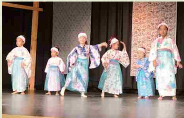
Abril de 2015 Organizamos el "Shinshunkai", evento del Okinawakai de Washington: Celebrado con el objetivo de afianzar la relación de amistad asociados mientras disfrutamos de la cultura okinawense.