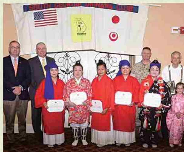
Día de agradecimiento a las islas de la región Asia Pacífico.

Fundado en 2007. En diferentes lugares realizamos presentaciones de artes tradicionales como danzas y taiko.