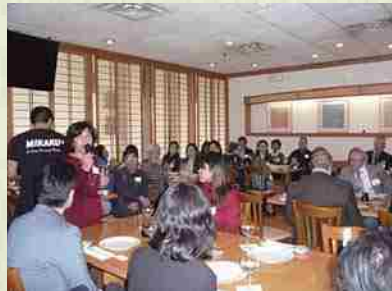
Enero de 2015 Evento del Okinawakai de Washington por año nuevo. Celebrado con el objetivo de afianzar la relación de amistad entre asociados.

Promovemos el intercambio entre nuestros miembros mientras disfrutamos de la cultura de Okinawa.