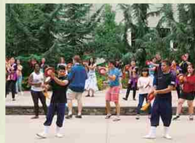
Septiembre de 2015 Taller de Eisa: Realizamos un taller con un instructor.