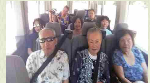
Agosto de 2014 Visita muy divertida al Kenjinkai de Atlanta.