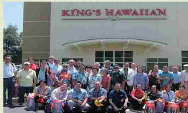
Visita de empresarios okinawenses a diversas empresas. Visita a "King's Hawaiian Bakery" cuyo propietario es un descendiente de okinawenses.