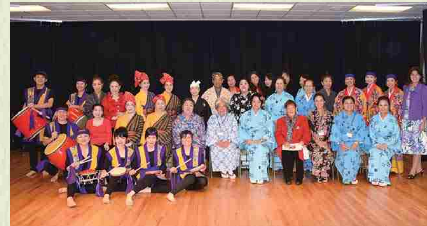
Evento por el 25º aniversario de fundación del Okinawa Kenjinkai de Utah: Foto de todos los artistas.

Creamos la oportunidad para profundizar el intercambio y lazos de amistad a través de la realización de experiencias culturales, entre otros.