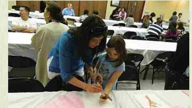
"Shinshunkai" 2014 ¡Disfrutamos con las manualidades sin importar ensuciarnos las manos!