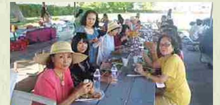
Picnic, verano de agosto Conversando entretenidamente luego de encontrarnos después de tiempo.