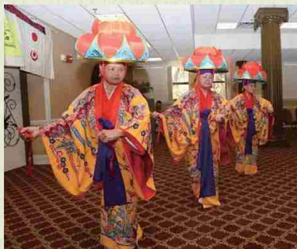
En el día de agradecimiento bailamos con gracia el "Yotsutake".