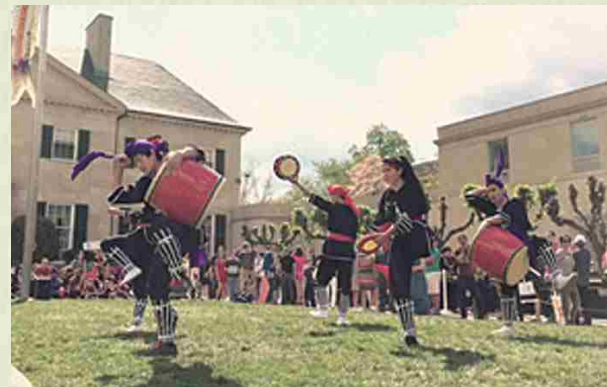
Mayo de 2015 "Passport DC Embassy Tour" (Tour de Embajadas- Pasaporte DC): Día donde la mayoría de embajadas abren sus puertas al público en general. Realizamos una presentación de eisa en el jardín de la antigua residencia del embajador de Japón.