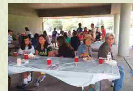
"THE NEW YEAR'S PARTY": Debido a las bajas temperaturas en Indiana, realizamos la fiesta del año nuevo lunar en una fecha posterior al original. Aprovechamos para interactuar con otros estados con la finalidad de mejorar nuestro performace en danzas y shamisen.