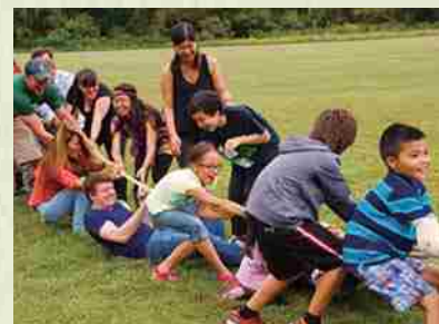
Septiembre de 2015 Picnic de Otoño: Uno de los eventos regulares del Okinawakai de Washington