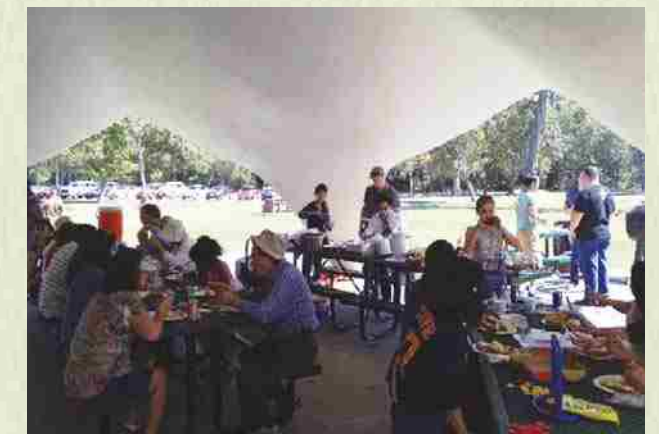
Realizamos un "Shinenkai" (Fiesta de año nuevo) en enero (platos especiales del kenjinkai, Ryuukyuu Kokusai Daiko, etc.), almuerzo en mayo (karaoke, "yuntakukai" o encuentro de conversación, etc.) y picnic en octubre.