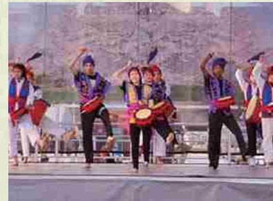
Abril de 2015 "National Cherry Blossom Festival" (Festival Nacional del Cerezo) celebrado en todo el territorio estadounidense. Presentamos la cultura de Okinawa.