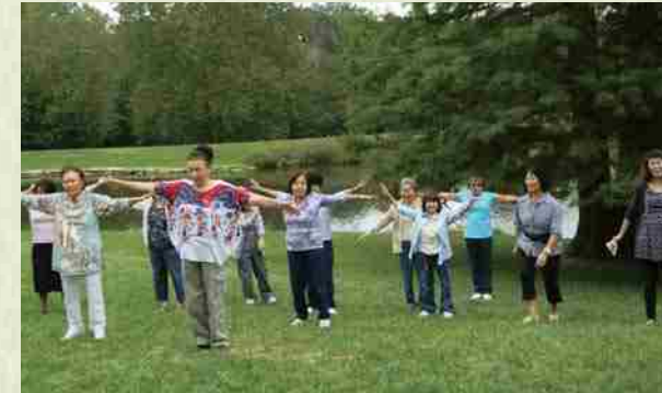
Picnic de Otoño, 2013 Realizando con alegría los movimientos del Radio Taiso. ¡Ichi ni, ichi ni!

52 personas, principalmente de primera y segunda generación, realizamos diversas actividades.