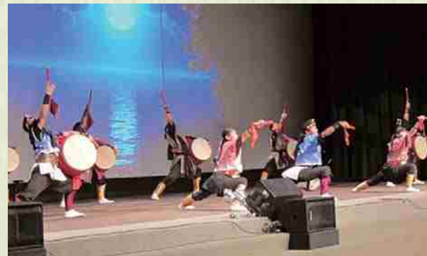
Agosto de 2015 Okinawa Kenjinkai de Atlanta : Ceremonia por el 30º aniversario, socializando con miembros del WUB. El grupo de eisa "Luck" de Ginoza fue recibido por descendientes de Atlanta y fascinó a la audiencia con un enérgico espectáculo.