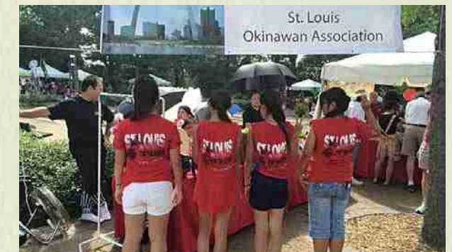
Festival de Japón 2015 Miembros del kenjinkai mostrando sus uniformes delante del estand.