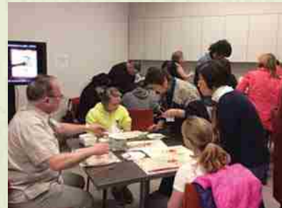
Marzo de 2015 Taller de Bingata: realizado en el Museo de Textiles de la Universidad George Washington.