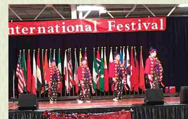
"INTERNATIONAL FESTIVAL": Desde hace 11 años participamos en un festival internacional que reúnen a grupos de diversos países. Bailamos y presentamos la cultura okinawense. Además vendemos mercancías para financiar gastos necesarios.