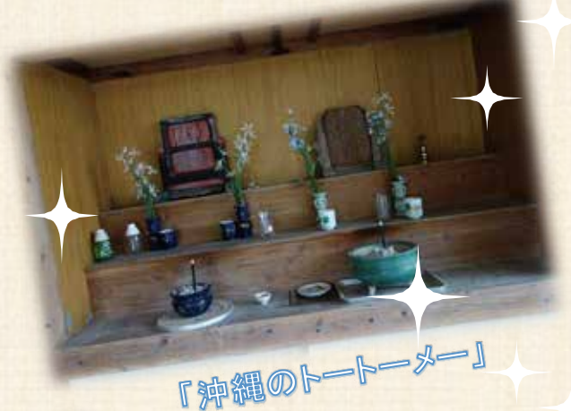
「沖縄のトートナー」