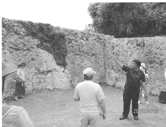
(2) 現場視察(西ツガ墓)