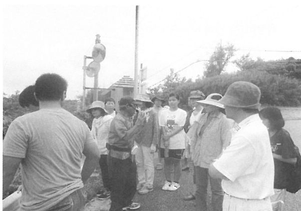
(2) 元入所者による施設案内と体験談