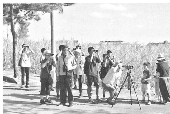
(2) 下地島での観察風景