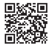
申請は こちら から

※注意「e-Shien」には上記①～③の方法でアクセスしてください。 Yahoo、Google等の検索エンジンでは検索出来ません。