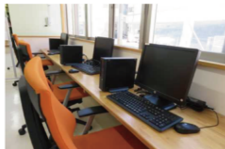
パソコンスペース