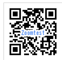
Zoomテストミーティング

事前に接続をテストされたい方は、 Zoomのテストミーティングをご利用ください。 https://zoom.us/ja/test