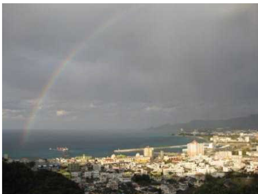
名護城からの風景