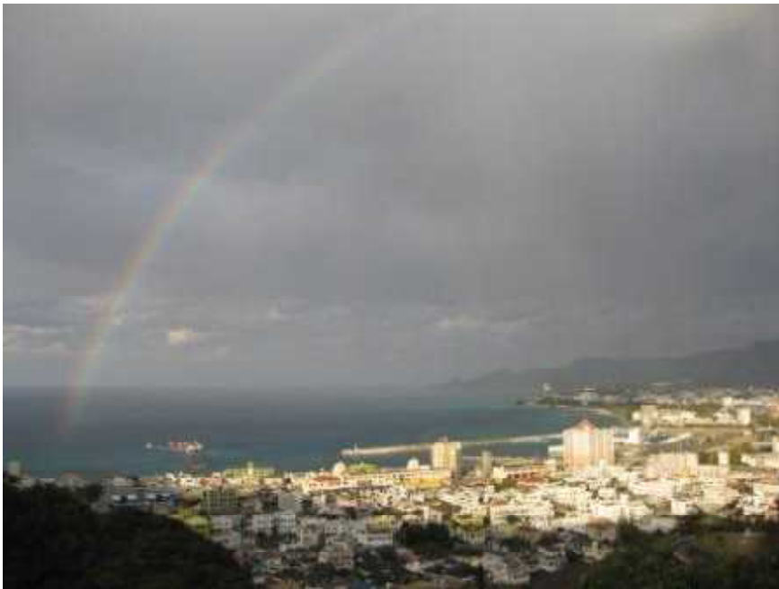
名護城からの風景