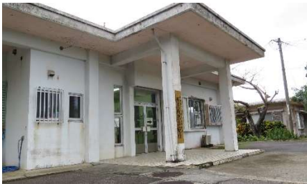
★診療所（学校から車で15分程度）