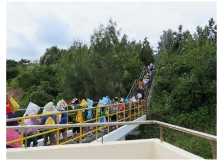
海洋教育その③【防災教育】