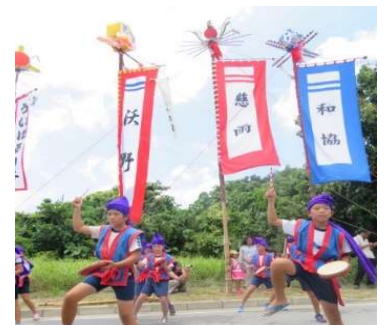
★地域の祭り（デンサー祭）