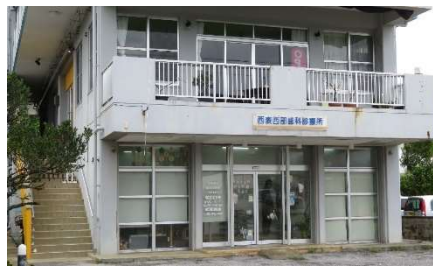
★歯科（上原地区にあります。 2階はおしゃれな飲食店♪）