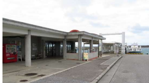
★上原港から学校まで車で3分程度♪