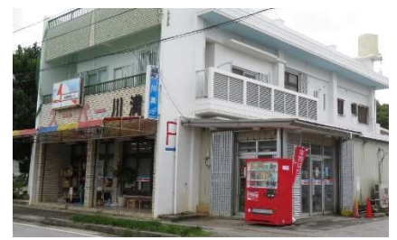
★品揃え豊富なスーパーが上原地区には2件あります！