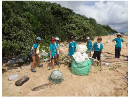
海洋教育その②【ビーチクリーン】