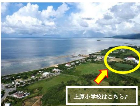
上原小学校はこちら♪

上原地区には、今回紹介した場所以外にも、竹富町役場西部出張所、お刺身屋さん（天ぷらが大人気！）、駐在所、ガソリンスタンド（2箇所）、信号1つ（学校前に交通安全指導用として）、教員宿舎、保育所（2才から入所可）や幼稚園などあり、一人暮らしでも家族連れでも誰でも安心して快適に過ごすことができます！近くの海岸では魚釣りや貝拾いもできます！上原小学校の子どもたちはとても元気で人なつこく素直です！転入してきた子もすぐ仲良くなれます。また、地域の方々も学校の諸活動に協力的で温かく、楽しく一緒に学校行事行っています。西表島では多くの野生生物に出会うことがあります。セマルハコガメ、カンムリワシ、運が良ければイリオモテヤマネコにも出会えるかも！！そんな、魅力的な西表島の上原小学校で是非一緒に働き、生活してみませんか！そんなあなたを、私たちは待ってま～す！！