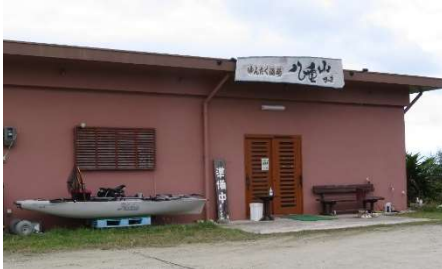
★上原地区には飲食店が多い！！