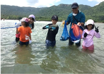
海洋教育その①【魚まき集会】