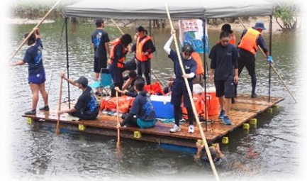
仲間川筏下り (R 5年6月)