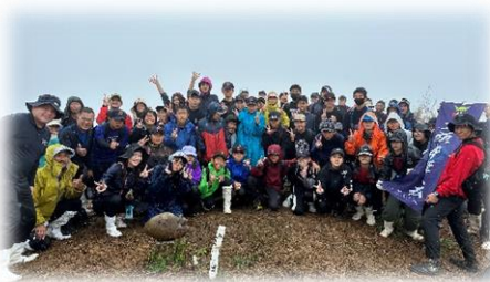
古見岳登山 (R 4年11月)