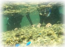
シュノーケリング体験