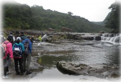
西表島横断 (R 3年11月)

3年サイクルで「西表島横断」「古見岳登山」「仲間川筏下り」を体験。苦しくとも一生の思い出に残り、たくましく育ちます。