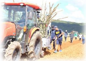
さとうきび苗植え