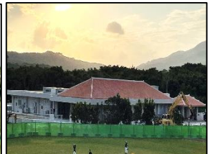
(東部地区複合施設)