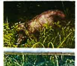
↑職員室裏にイノシシ参上！！