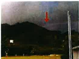
↑校庭に虹が架かりますよ♡

→イルカさんも遊びに来ますよ。地域の方が「イルカが来てるド〜。見に行くか〜。」っといって、船を出してもらって。