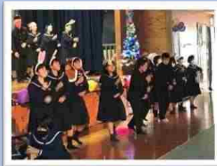
クリスマスライブ