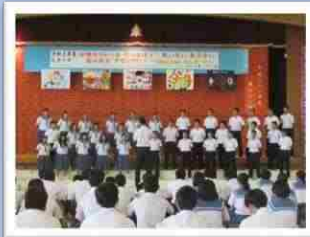
毎年恒例「合唱コンクール」