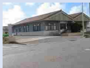
八重山平和祈念館