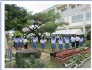
生徒会ミーティング