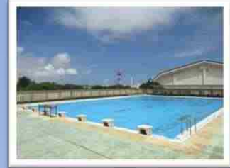
石垣で一番空に近いプール