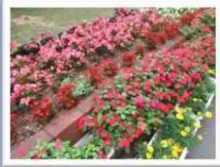
季節の花が咲いています