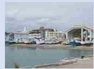
石垣漁港（通称：新川漁港）

本校「石垣市立石垣中学校」は、創立75年目を迎え、地域の人々や保護者の皆さんに支えられて、伝統と歴史をつないできた中学校です。