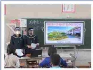
校区内小学校での石中紹介