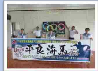
先輩の活躍を喜ぶ