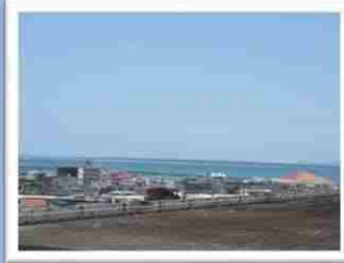
4階から見える青い海と竹富島