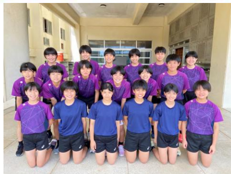
女子バレー部県3位!目指せ全国