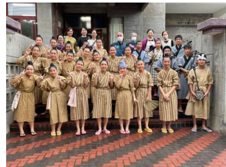
郷土芸能部。8月に全国中文祭に出場