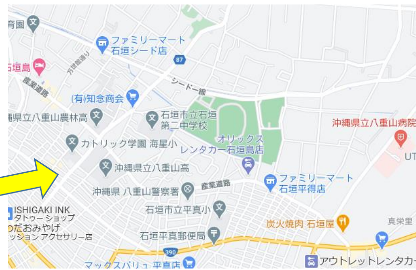
病院・保育所・小学校・高等学校・スポーツ施設がすぐ近く！ 校訓「継続は力なり」が登下校を見守ります