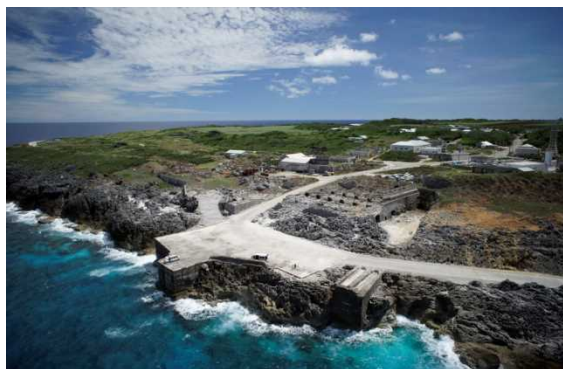
燐鉱石採掘に関連する一連の生産施設全景