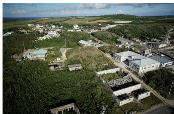
社宅及び福利厚生施設等の生活関連施設