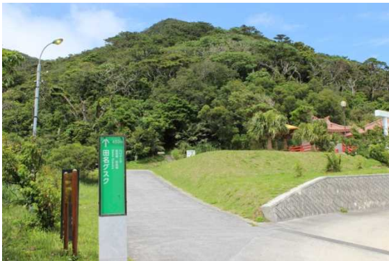
田名城跡遠景並びに登り口