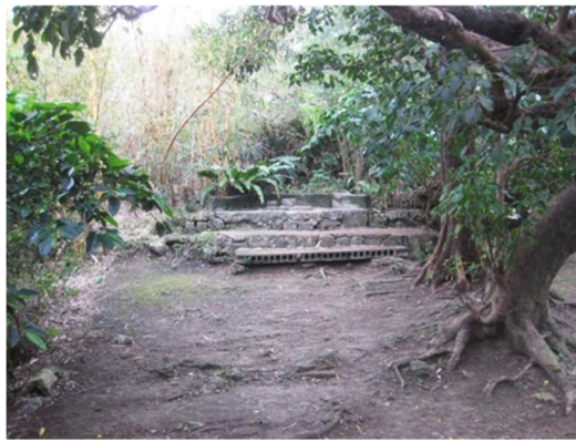
弁之御嶽 小嶽 西向き拝所