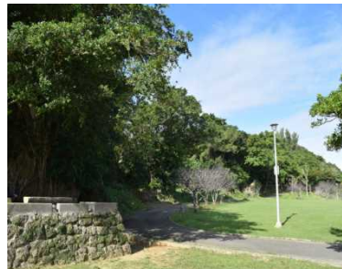
ゑぞゑぞのいしぐすく・金ぐすく（伊祖グスク）：浦添市