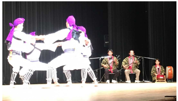
「アヤグ」（前川区伝統芸能保存会） 第60回九州地区民俗芸能大会 本公演より