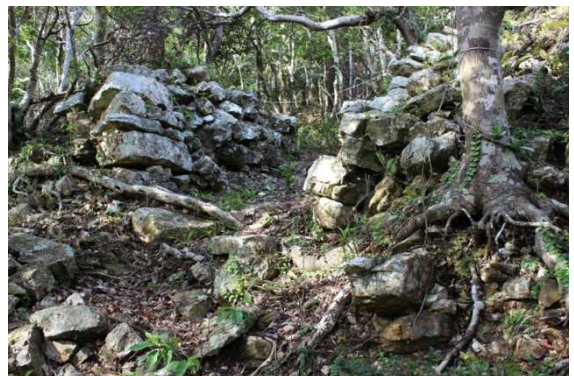
頂上部への入り口