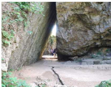
斎場嶽（斎場御嶽）：南城市