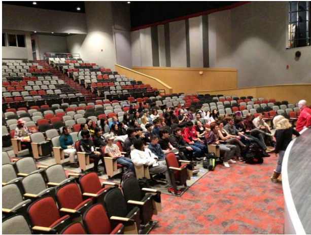
グローバル・リーダー育成海外短期研修事業 アメリカ校等教育体験研修