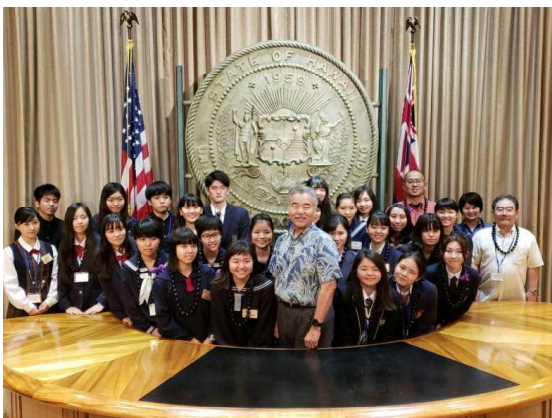
沖縄県高校生海外雄飛プログラム