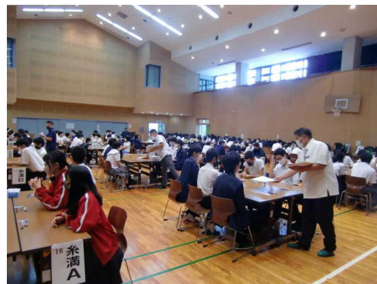
第12回沖縄科学グランプリ