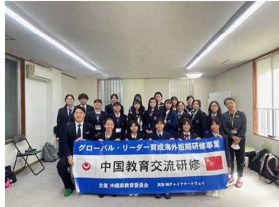
グローバル・リーダー育成海外短期研修事業 中国教育交流研修