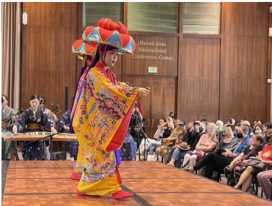
高校生伝統芸能分野海外就業体験事業