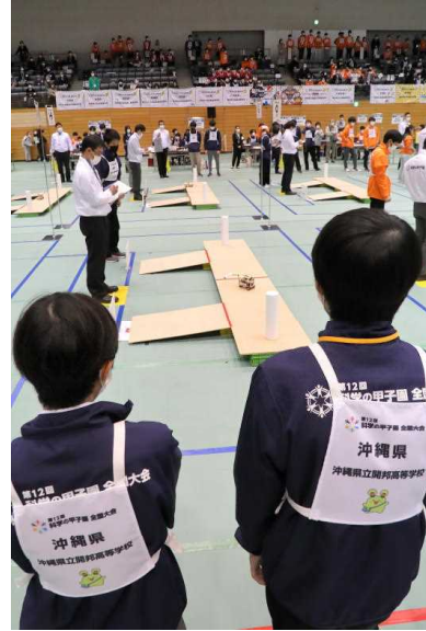
科学の甲子園全国大会